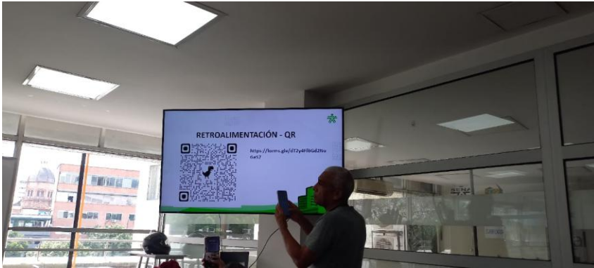
Imágenes Nro 10. Capacitación en el SENA. Alistamiento. 15 de Abril de 2026. De 9 am a 12 m.