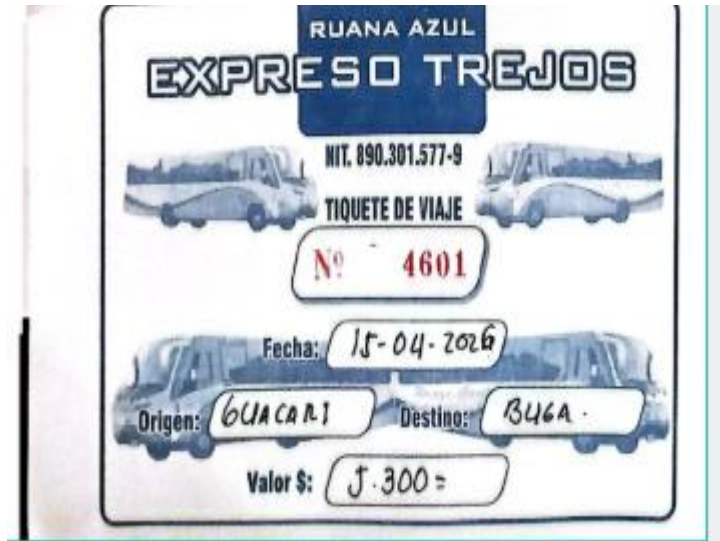
Dia 3. Evidencia fotográfica GUACARI 22de Abril de 2026