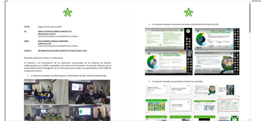
Fuente: Informe de divulgación de elementos estructurales 2026.

ID 54 Planificar y ejecutar las inducciones en el Sistema Integrado de Gestión y Autocontrol - SIGA al equipo del Centro de Formación, asegurando la comprensión de los elementos estructurales, y las temáticas priorizadas asociadas al sistema. (Actividad asociada al numeral 7.2 del SGC)