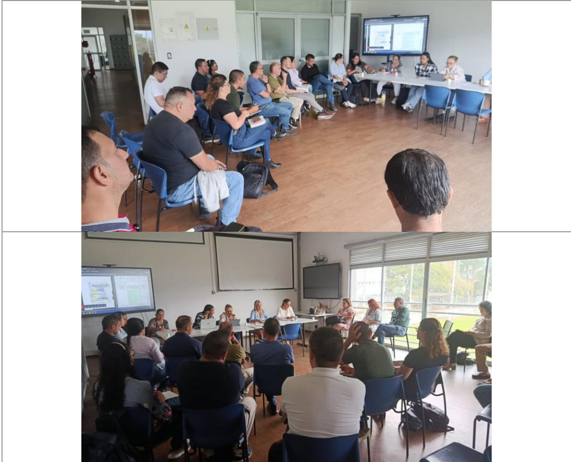
Formato de asistencia