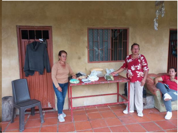
Aplicación de nuevas alternativas de alimentación y suplementación en acuicultura” grupo Santa Helena del Opón número de ficha 3504060: Estudio de la normatividad y los requerimientos de las buenas prácticas en piscicultura.