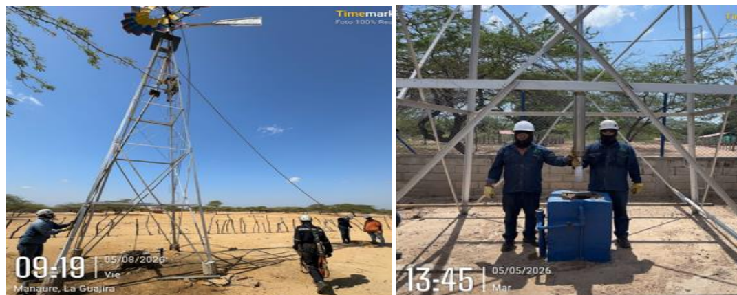
Ilustración de los mantenimientos.