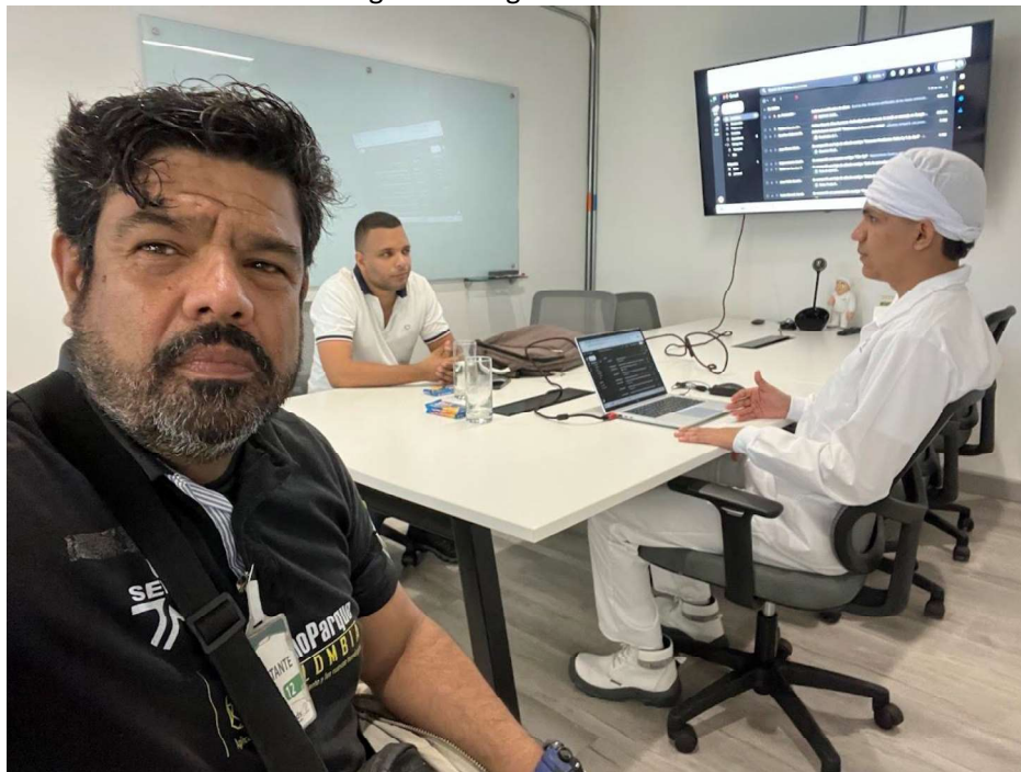
Anexo 2. Registro Fotográfico.