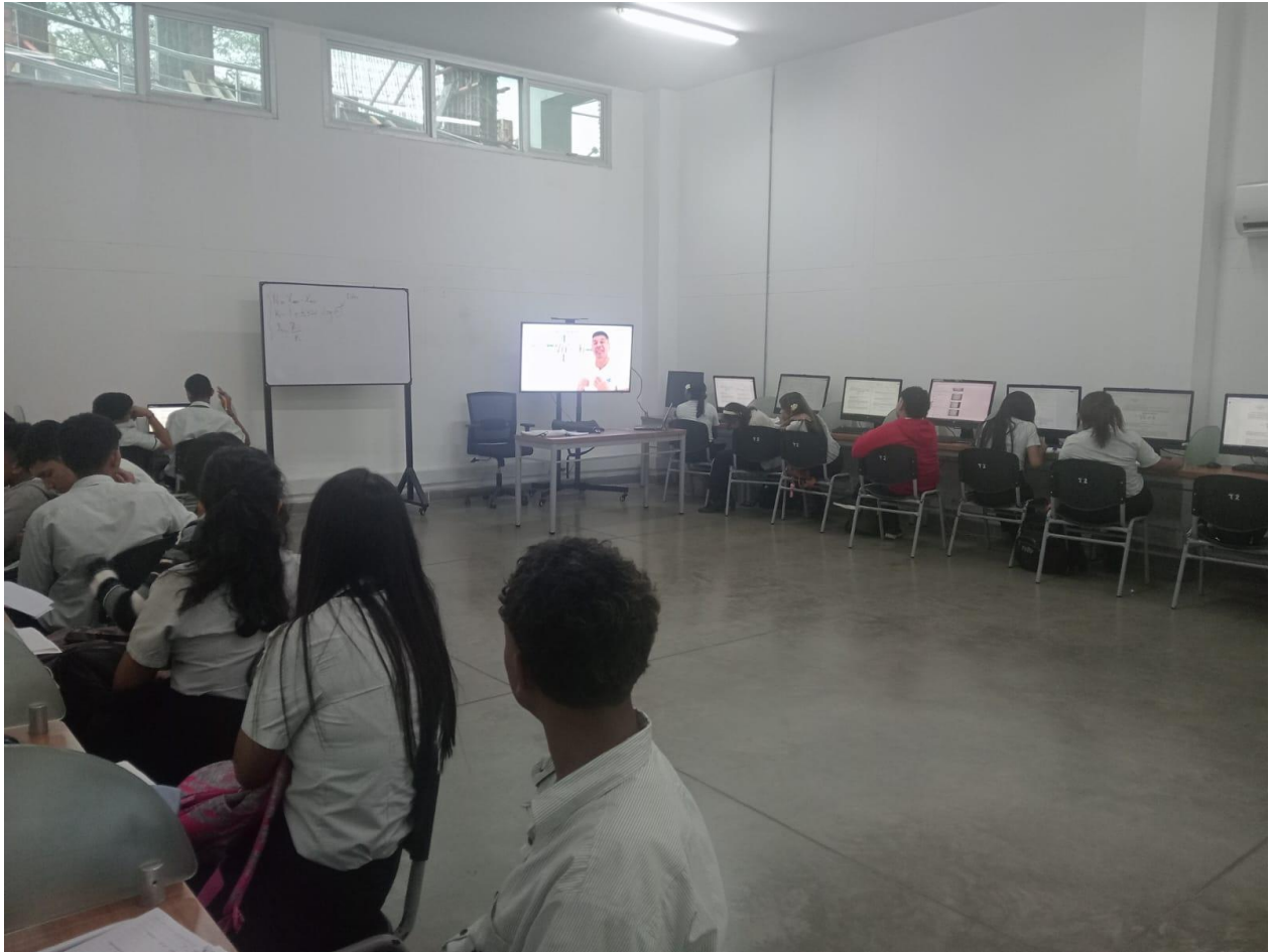
Ficha 3412756 Competencia Procesamiento De Datos