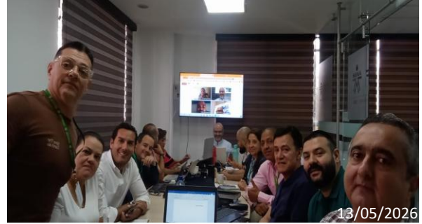
Registro Fotográfico de reunión de equipo con la Profesional de Acompañamiento – Virtual Plataforma Microsoft Teams – 13 de mayo de 2026.