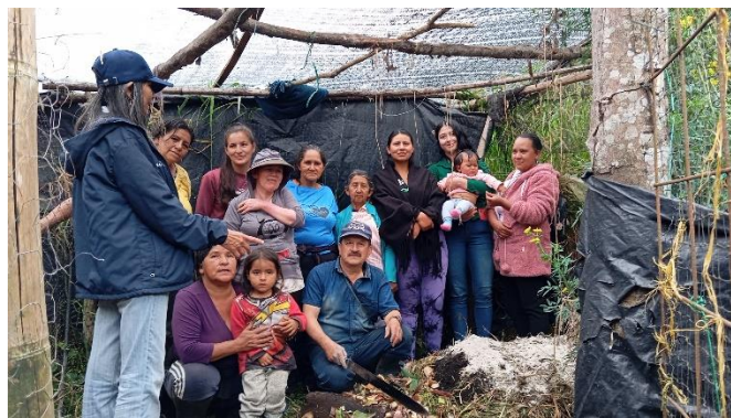
Formación complementaria en socialización sobre abonos orgánicos edáficos. Ficha 3446561.