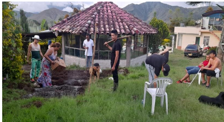
Formación complementaria en preparación y desinfección del terreno. Ficha 3440076.