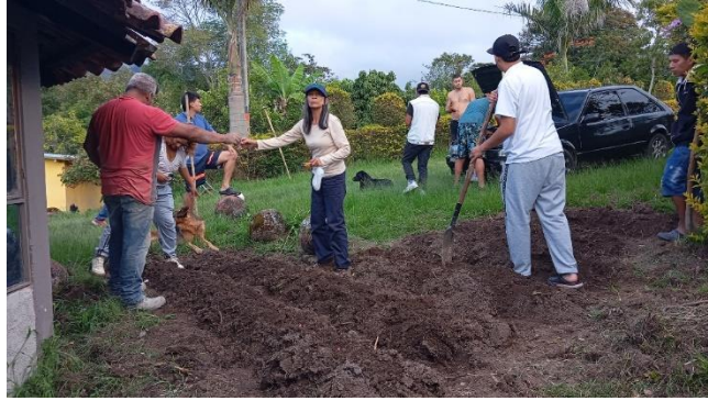
Formación complementaria en siembra directa de cultivos. Ficha 3440076.