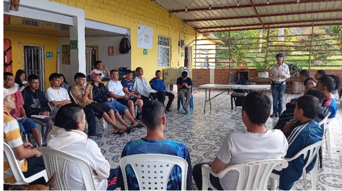
Formación complementaria socialización de los diferentes sistemas de siembra. Ficha 3440076.