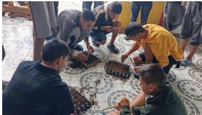
Formación complementaria en desinfección del semillero y siembra de semillas. Ficha 3440076.