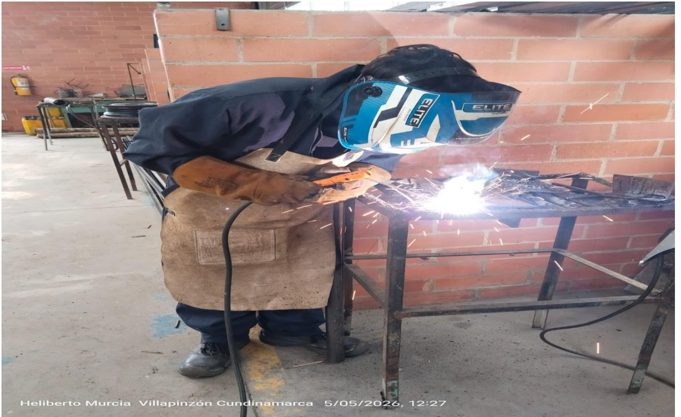
Heliberto Murcia Villapinzón Cundinamarca 5/05/2026, 12:27