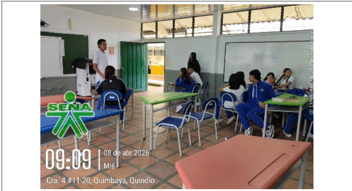
Quimbaya. Tema: Se diseñaron los tres momentos para llevar a cabo un evento empresarial.

04. 08/04/2026 Orientar formación profesional en el programa de articulación con la media en el Técnico en el Técnico en Asistencia Administrativa a la ficha 3409510 de la IE Mercadotecnia María Inmaculada de