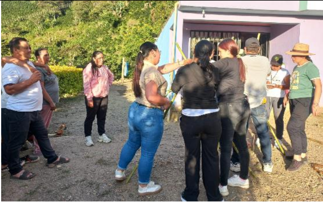
Registro fotográfico de las actividades de Formación Profesional Integral del programa CAMPESENA, en el municipio de Samaniego, ficha 3454828