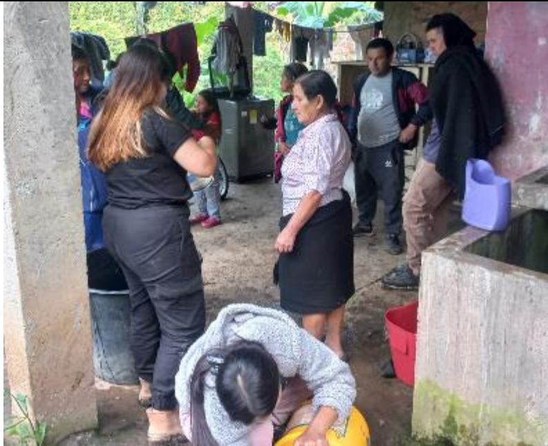
Registro fotográfico de las actividades de Formación Profesional Integral del programa CAMPESENA, en el municipio de Cumbitara, ficha 3462368