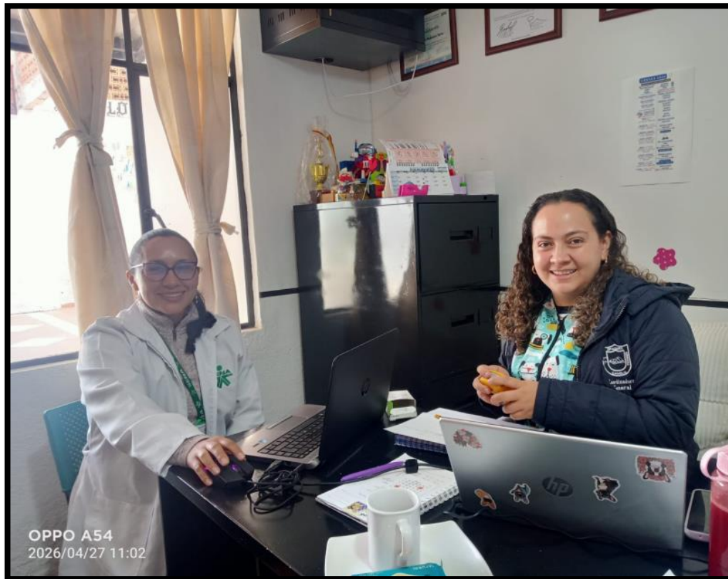
OPPO A54 2026/04/27 11:02