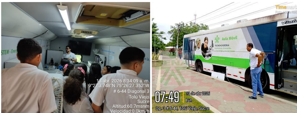
Aula Móvil IE Heriberto Garcia Tolu Viejo – 13/04/2026