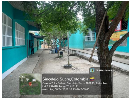
Formación Cancelada IETA La Gallera – 08/04/2026