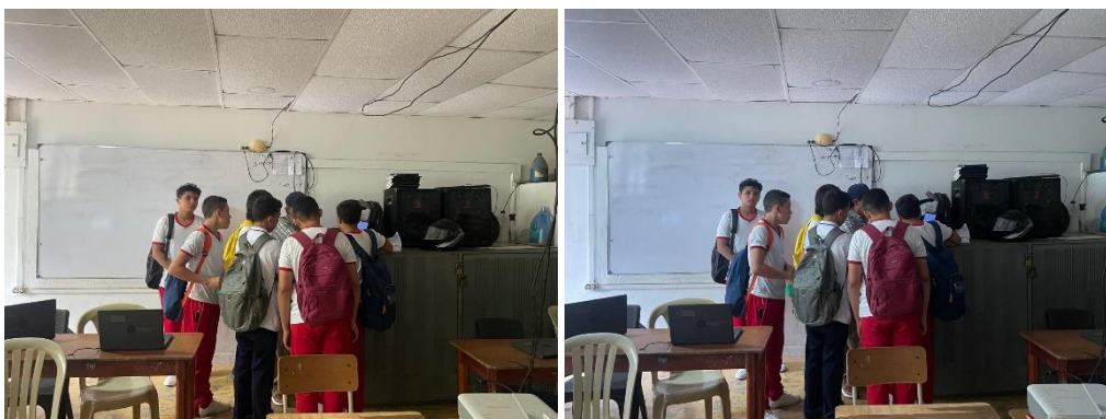
Ejecución de la Formación – IE Liceo Carmelo Percy Vergara – Corozal Sucre – 14/04/2026