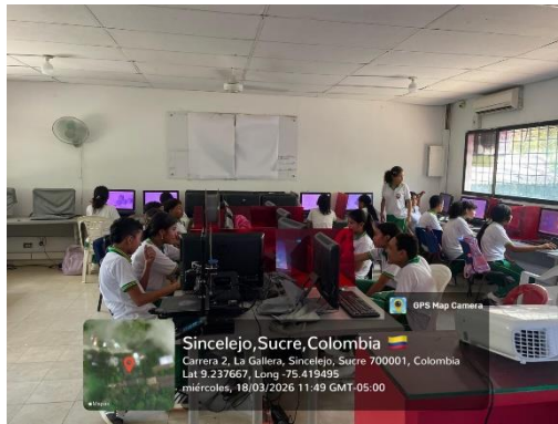
Ejecución de la Formación IETA La Gallera – 18/03/2026