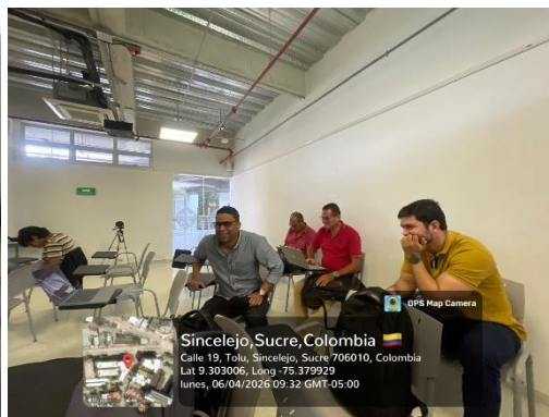
Reunión Boston - seguimiento Sennova 06-04-2026