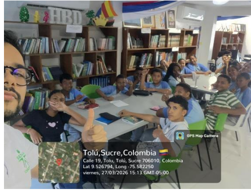
Ejecución de la Formación IE JOSE YEMAIL TOUS – Santiago de Tolú Sucre – 27/03/2026