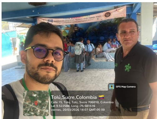
Formación Cancelada IE JOSE YEMAIL TOUS – Santiago de Tolú Sucre – 20/03/2026