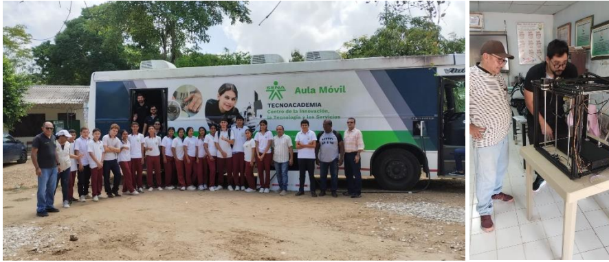
Aula móvil IE hatu nuevo - 09/04/2026