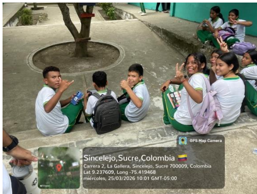
Formación Cancelada IETA La Gallera – 25/03/2026