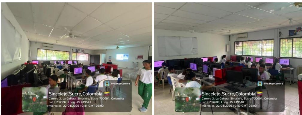
Ejecución de la Formación IETA La Gallera – 22/04/2026