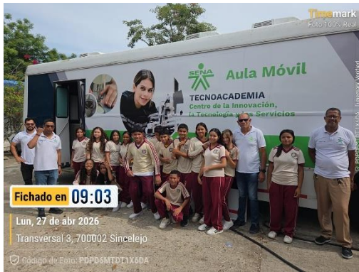
Visita Aula móvil IE Rafael Núñez - 27/04/2026