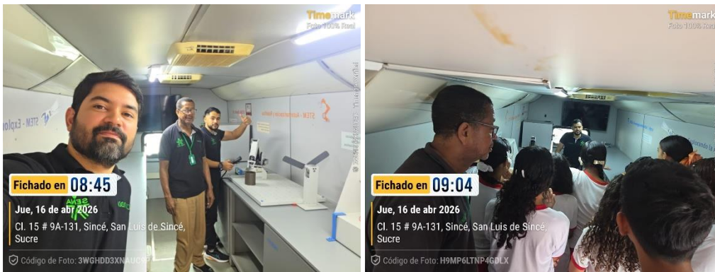
Visita Aula móvil la salle Since 16/04/2026