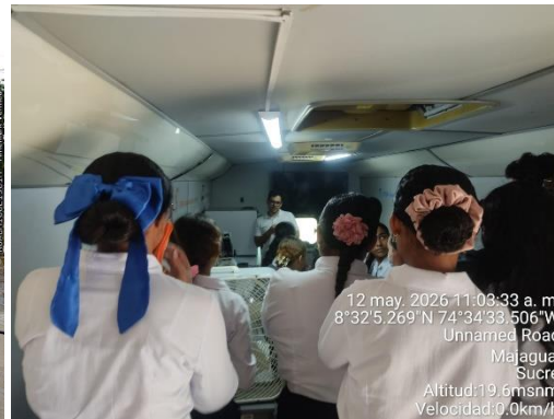
Visita Aula móvil Sena El Palomar majagual Sucre - 12/05/2026