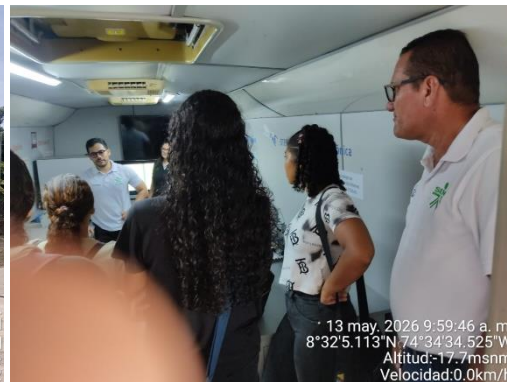
Visita Aula móvil Sena El Palomar majagual Sucre - 13/05/2026