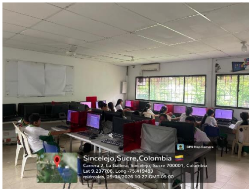
Ejecución de la Formación IETA La Gallera – 29/04/2026