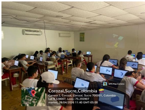
Ejecución de la Formación IE LICAPEVE – 28/04/2026