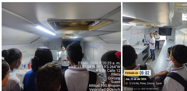
Aula Móvil IE el mamon - 23/04/2026