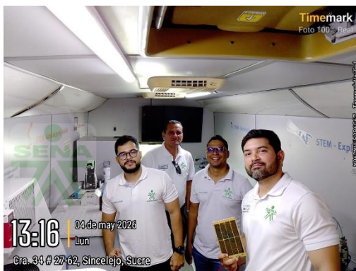
Visita Aula móvil - IE SANTA ROSA DE LIMA SINCELEJO – 04/05/2026