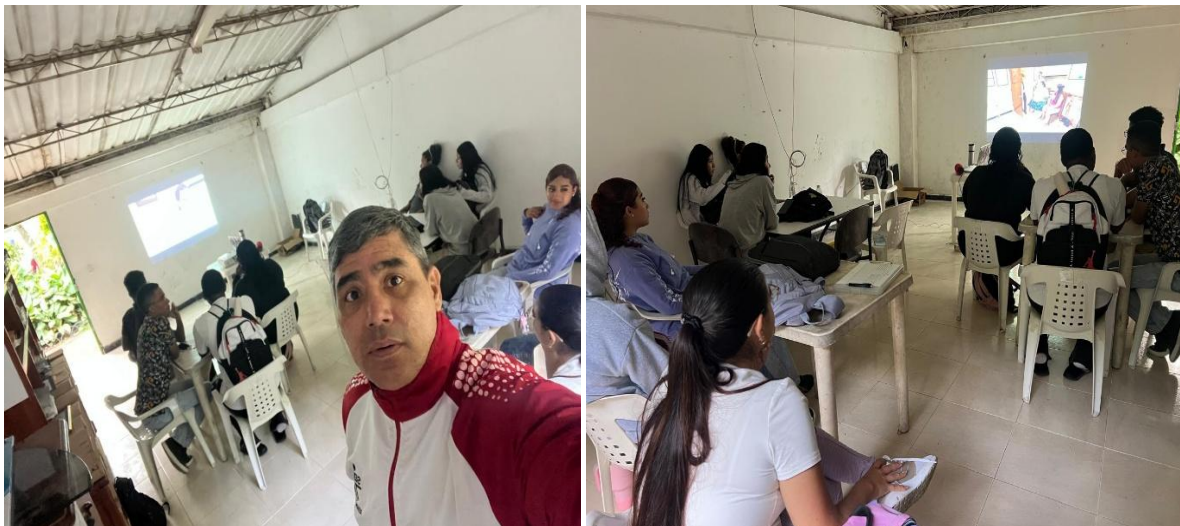
Día 3: Tuluá – Florida – Tuluá - mayo 7 de 2026.