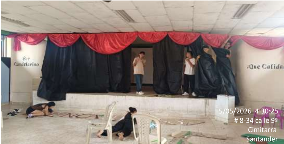
Registro del aula 101 de préstamo sede Sena Cimitarra mayo del 2026.