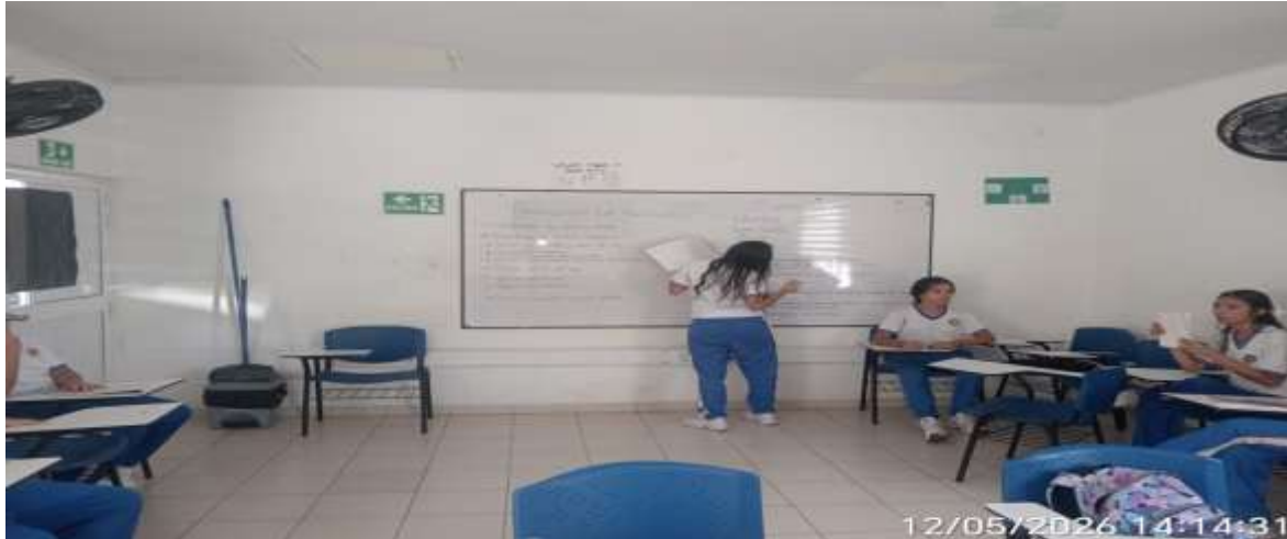
Foto de capacitación de primeros auxilios y