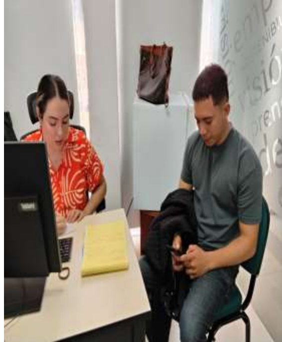
Ilustraciones: Atención en Sala