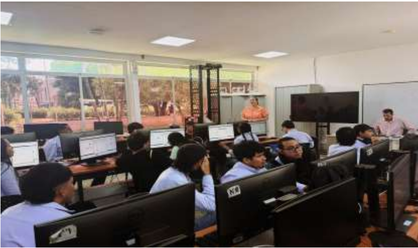
Ilustraciones: Orientación a Aprendices SENA