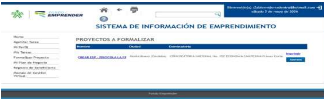
Ilustraciones: Presentación de Proyectos en las diferentes convocatorias