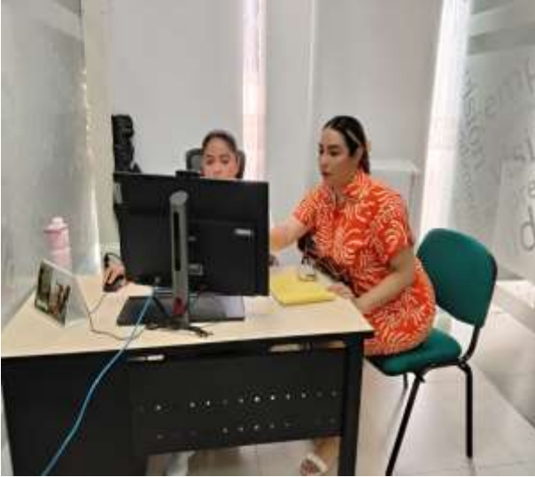
Ilustraciones: Entregables con Apoyo administrativo