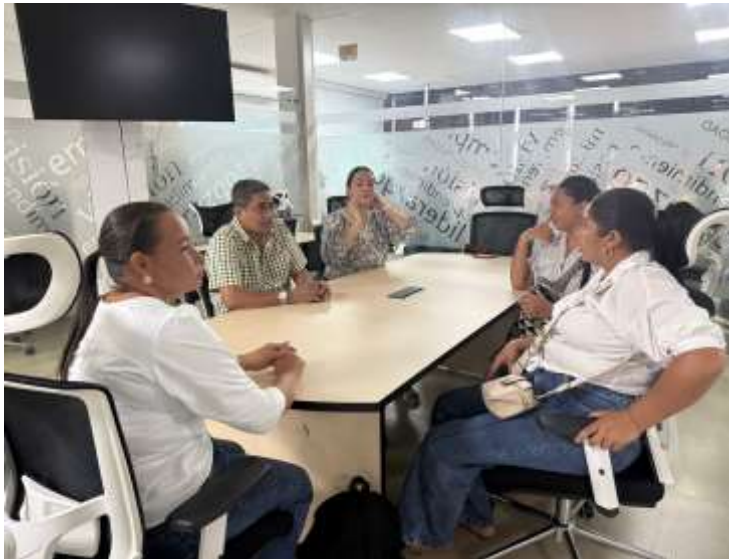
Ilustraciones: Reunión con emprendedores y el Líder de Emprendimiento