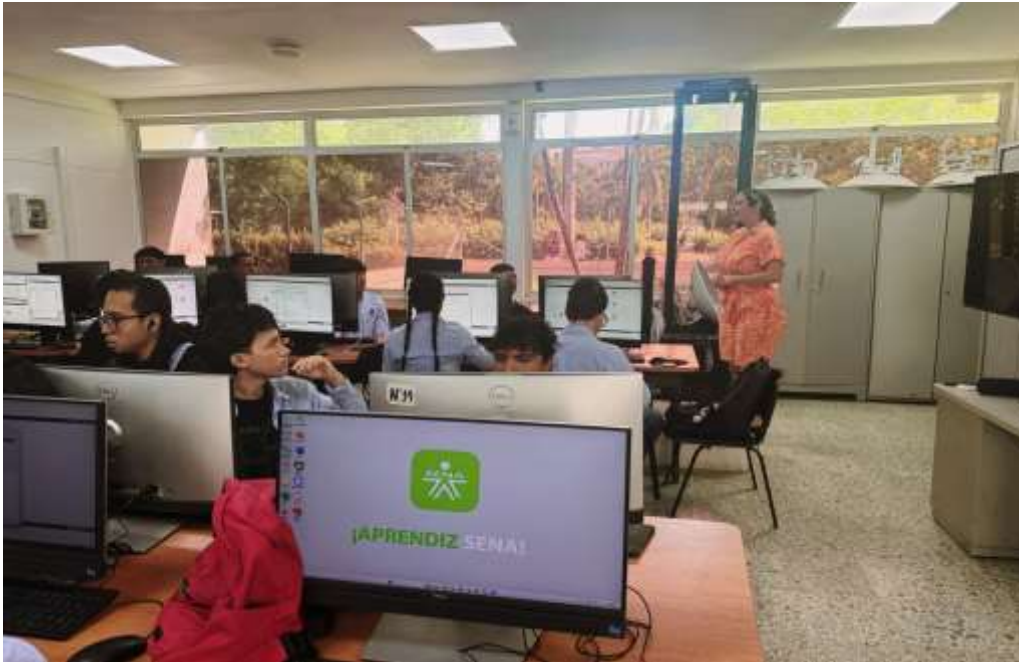
Ilustraciones: Orientación a Aprendices SENA