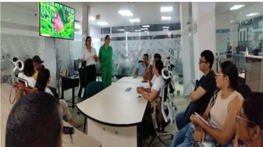
Ilustraciones: Entrenamiento Taller de Plan de Negocio 1