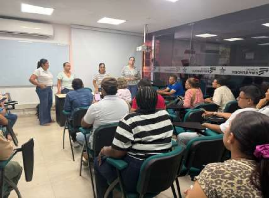
Ilustraciones: Jueves de Emprendimiento