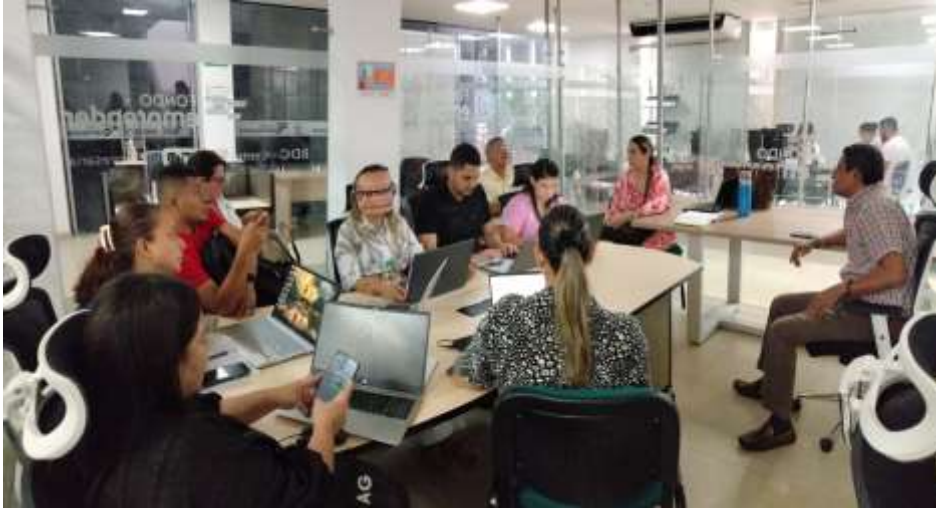
Ilustraciones: Reunion y Listado de Asistencia de Indicadores con el Lider de Emprendimiento