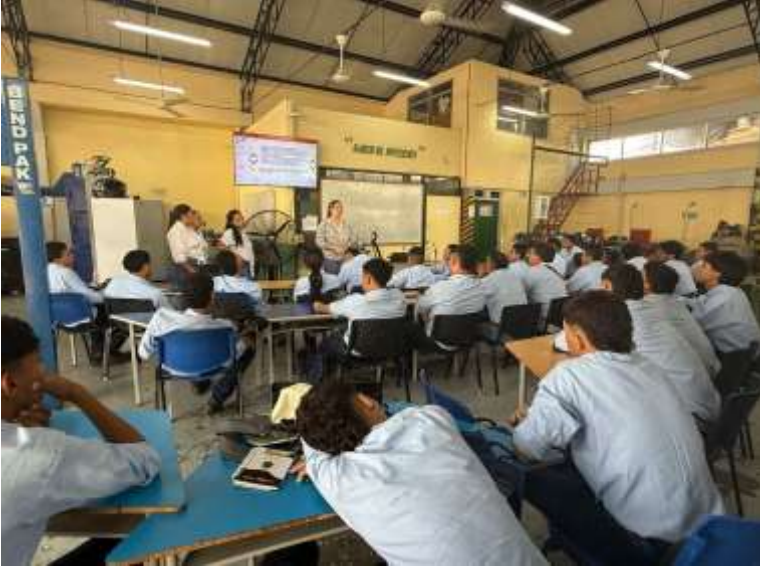
Ilustraciones: Contrapartida de WEYWLUZ SAS con aprendices