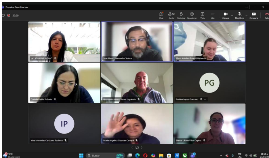
Empalme por entrega de coordinación