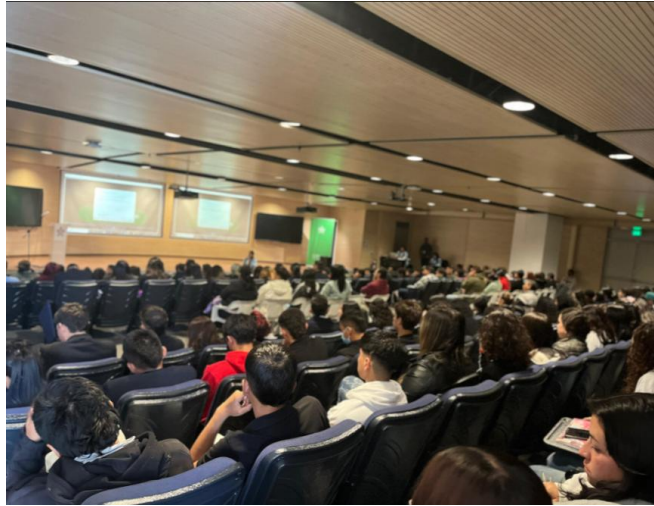
Actividad programada por el área de bienestar