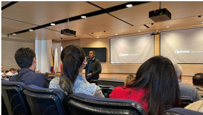
Reunión con subdirector