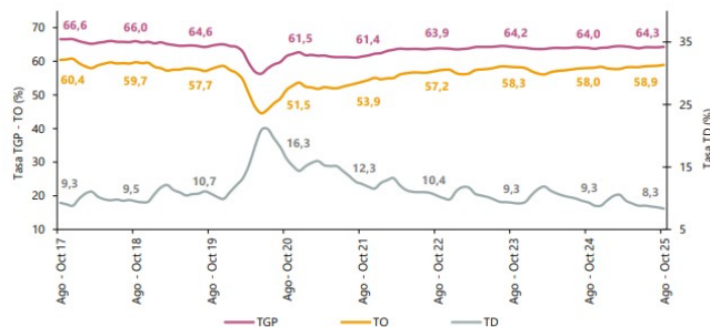
Gráfico 4. Tasa global de participación (TGP), Tasa de ocupación (TO) y Tasa de desocupación (TD) Agosto - octubre (2017 - 2025)

En el total nacional, la tasa de desocupación del trimestre móvil agosto - octubre 2025 fue 8,3%, lo que representó una disminución de 1,0 puntos porcentuales respecto al trimestre móvil agosto - octubre 2024 (9,3%). La tasa global de participación se ubicó en 64,3%, mientras que en el mismo periodo del año anterior fue 64,0%. Finalmente, la tasa de ocupación fue 58,9%, lo que representó un aumento de 0,9 puntos porcentuales respecto al trimestre móvil agosto - octubre 2024 (58,0%).