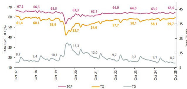
Gráfico 1. Tasa global de participación (TGP), Tasa de ocupación (TO) y Tasa de desocupación (TD) Total nacional Octubre (2017 - 2025)

En el total nacional, la tasa de desocupación del trimestre móvil agosto - octubre 2025 fue 8,3%, lo que representó una disminución de 1,0 puntos porcentuales respecto al trimestre móvil agosto - octubre 2024 (9,3%). La tasa global de participación se ubicó en 64,3%, mientras que en el mismo periodo del año anterior fue 64,0%. Finalmente, la tasa de ocupación fue 58,9%, lo que representó un aumento de 0,9 puntos porcentuales respecto al trimestre móvil agosto - octubre 2024 (58,0%).