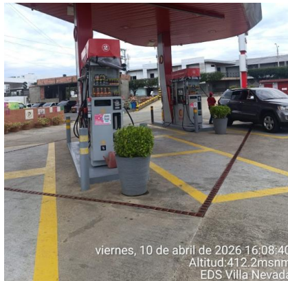
Fotografía 1. EDS Villa Nevada, municipio de Villa del Rosario.

3. Elaborar los respectivos informes técnicos de soporte de las visitas realizadas, remitiéndolos a la supervisión del contrato para el trámite administrativo correspondiente, donde se dé cuenta de la verificación del cumplimiento de los trámites y permisos ambientales obligatorios, según el tipo de actividad económica, tales como: