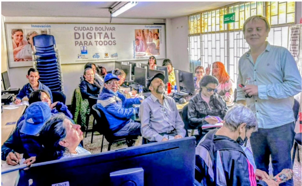
Casa LGBTI Edwar Hernandez, Kennedy