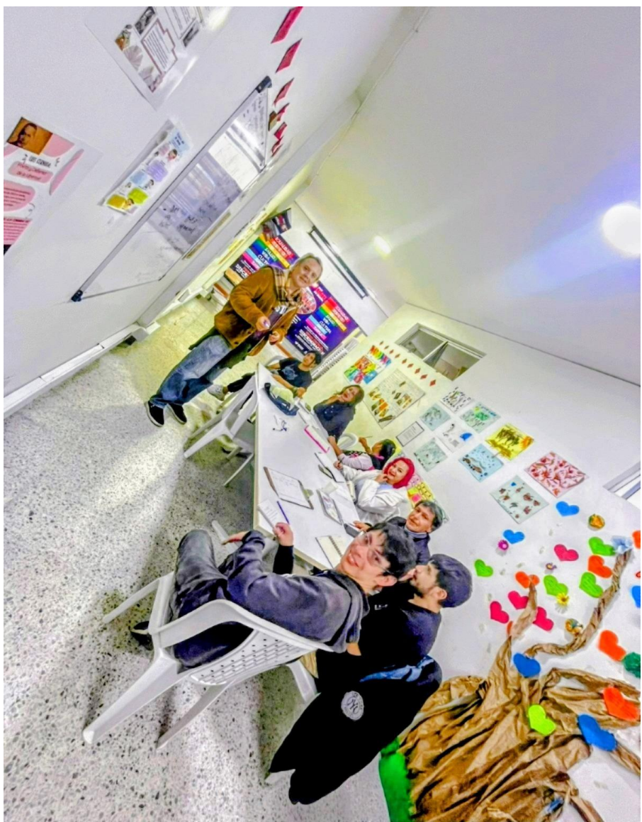
Centro de Experiencia TIC, Universidad Distrital