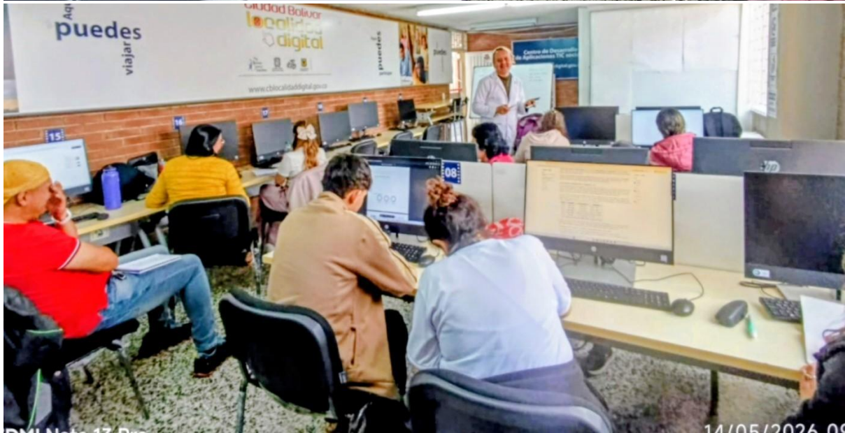
Centro de Experiencia TIC, Casa de la Cultura de Ciudad Bolívar