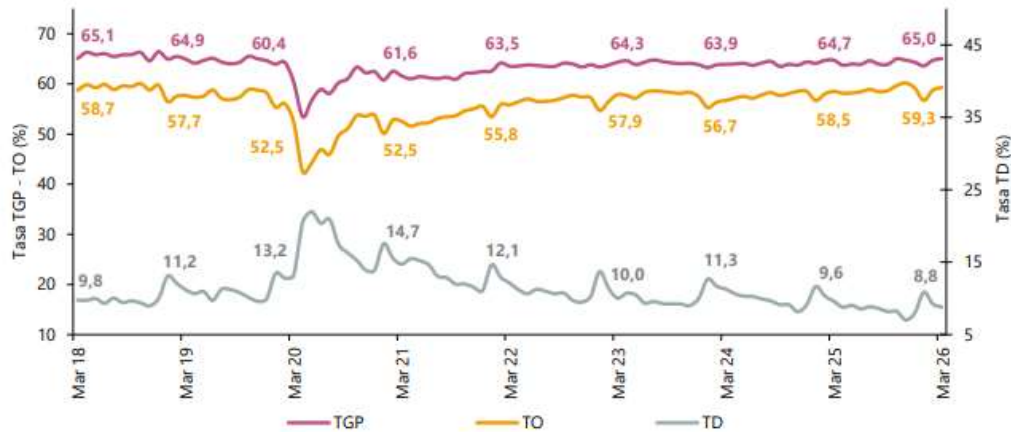
Gráfico 2. Tasa global de participación (TGP), Tasa de ocupación (TO) y Tasa de desocupación (TD) Total nacional Marzo (2018 - 2026)