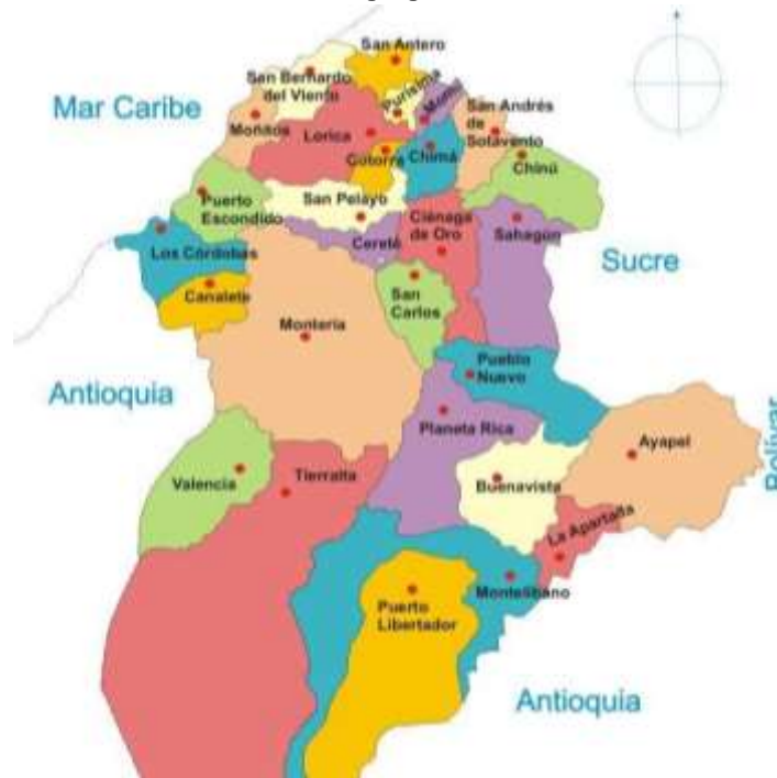
Ilustración 1. Ubicación geográfica, Montería, Córdoba.