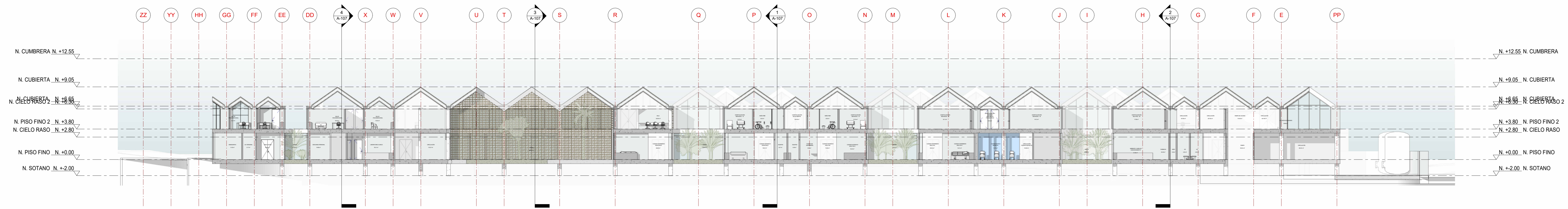
A SECCIÓN ARQUITECTONICA A-A' - HOSPITAL DE PAZ CUMARAL META 1 : 200