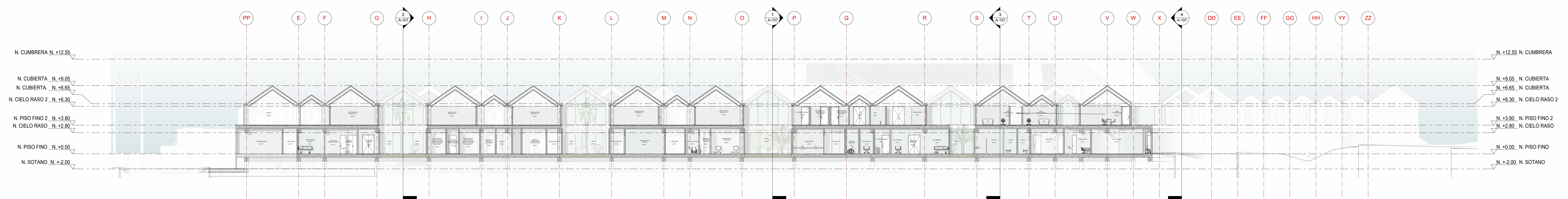
B SECCIÓN ARQUITECTONICA B-B' - HOSPITAL DE PAZ CUMARAL META 1 : 200