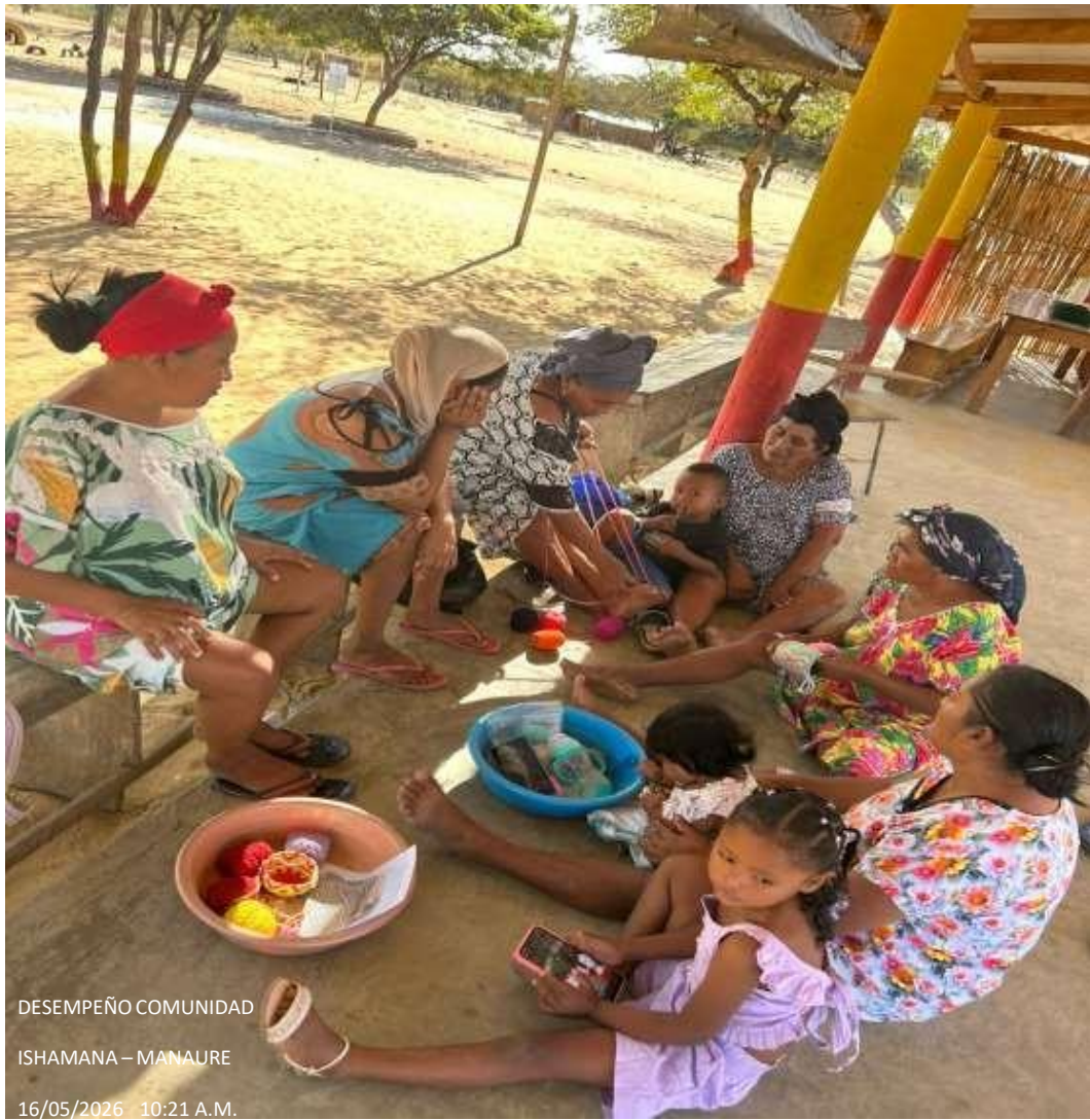
Imagen 4. Prueba de desempeño norma 250701123 Entrelazar hilos según técnicas de tejidos y tipo de agujas.