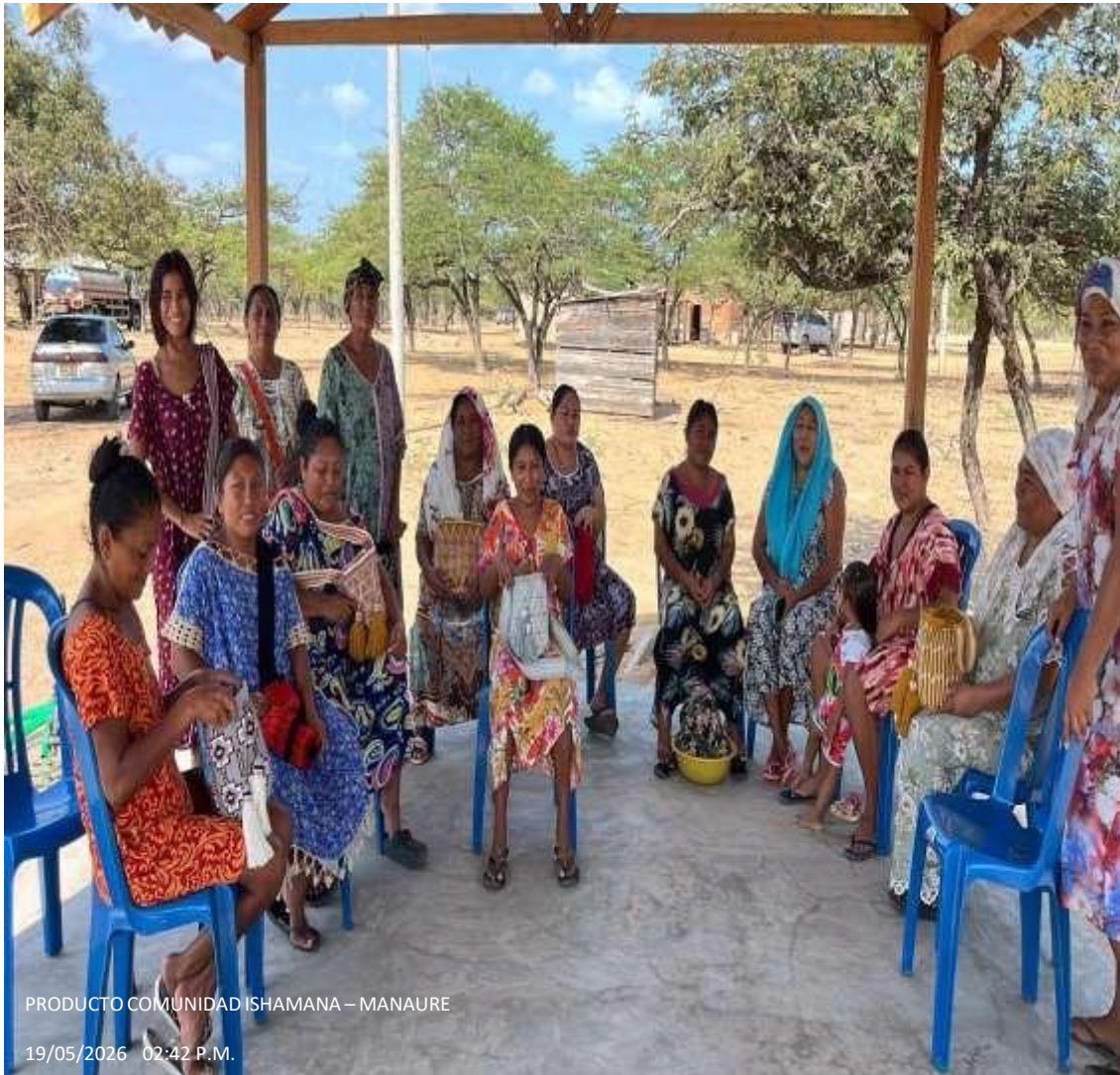
Imagen 5. Prueba de producto norma 250701123 Entrelazar hilos según técnicas de tejidos y tipo de agujas.