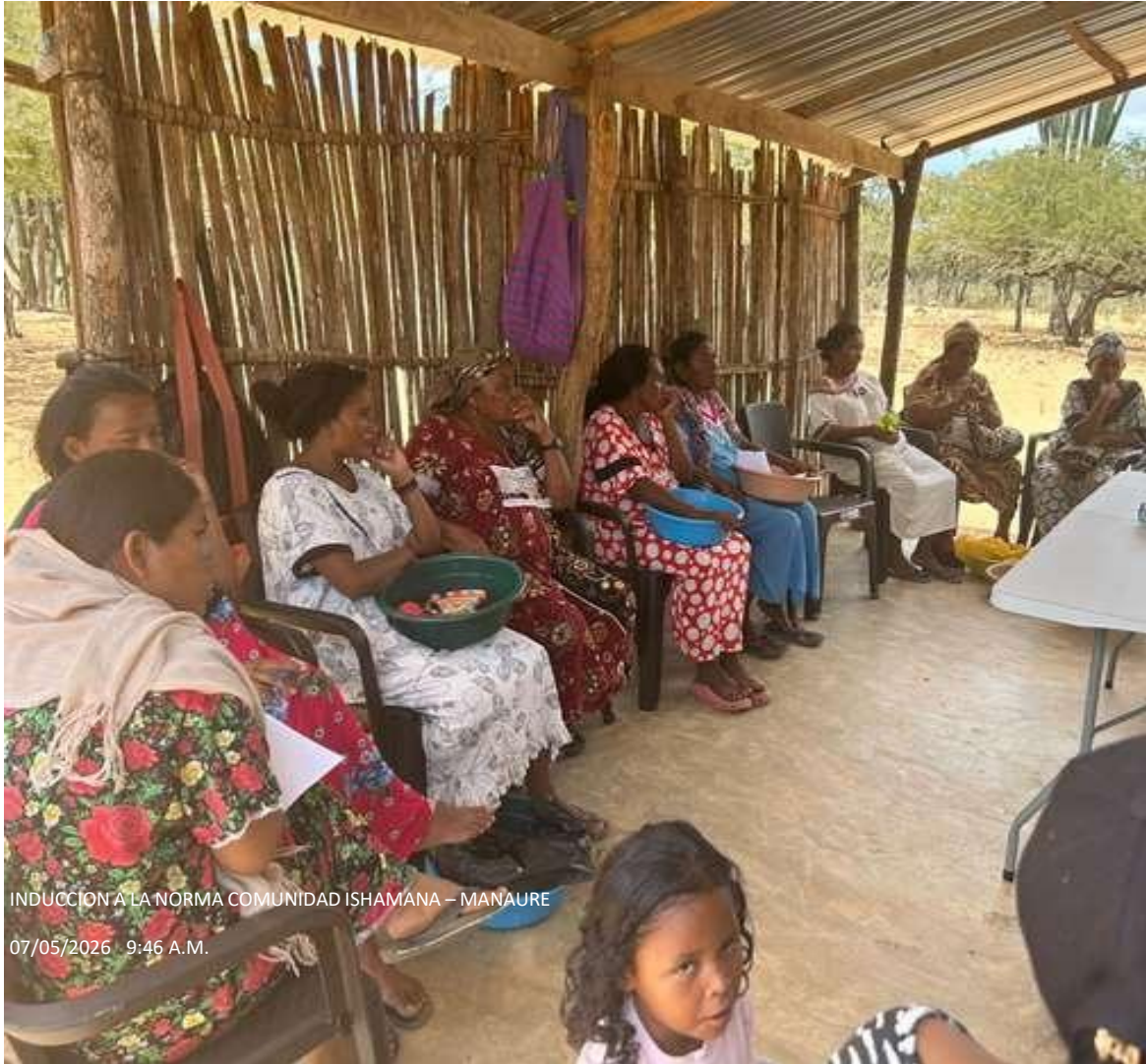
Imagen 1. Inducción bajo la norma de competencias laborales código 250701123 Entrelazar hilos según técnicas de tejidos y tipo de agujas.

Inducción del proceso de certificación de competencias laborales del proyecto PN3-2026-44-9524-P194 Grupo 3 ubicados en el municipio de Manaure.