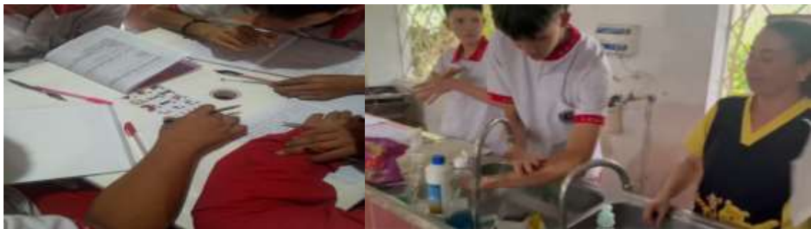
Evidencia 2- Material fotográfico del desarrollo del curso en higiene y manipulación de alimentos grupo 3457790. Colegio Luis Carlos Galán. Vrda. Chinauta.