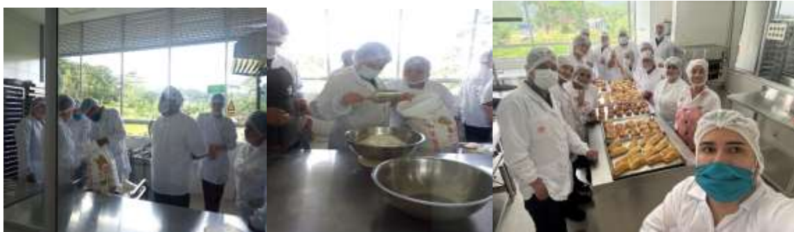
Evidencia 6- Material fotográfico del desarrollo de procesos de panadería grupo 3316227. Tecnólogo en control de Calidad en la Industria de Alimentos.