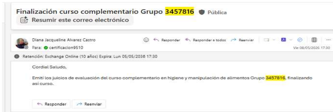
Evidencia 17. Captura de pantalla del correo de finalización del complementario Grupo 3457816 a la dependencia de certificación.