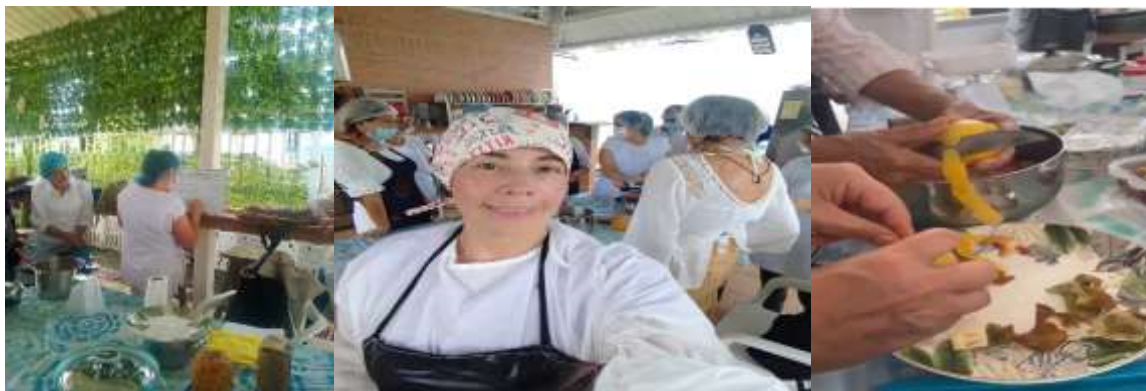
Evidencia 8- Material fotográfico del desarrollo del curso en elaboración de conservas de frutas y hortalizas grupo 3516171. Silvania. Vrda. Panamá bajo.