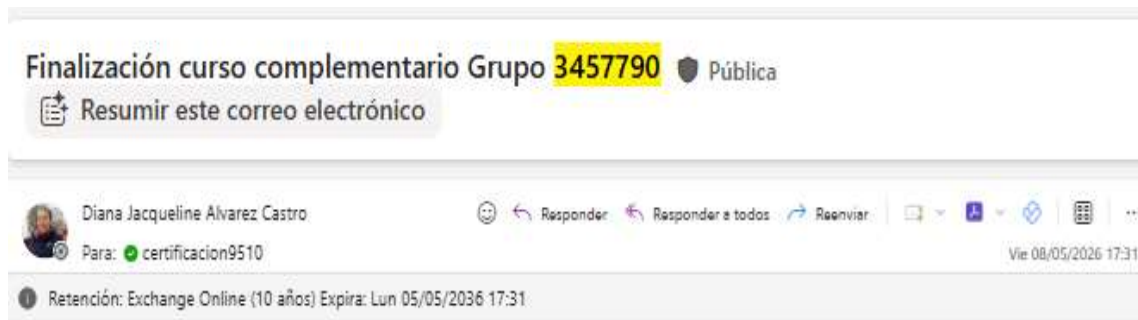
Evidencia 18. Captura de pantalla del correo de finalización del complementario Grupo 3457790 a la dependencia de certificación.