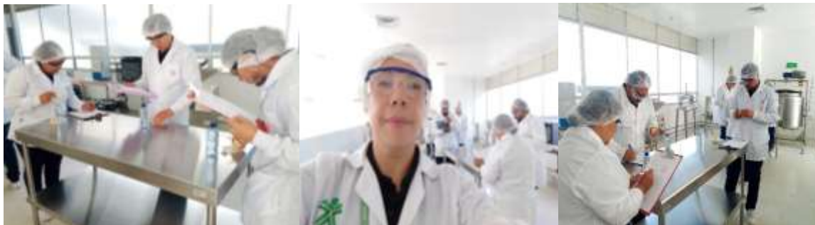
Evidencia 7- Material fotográfico de análisis sensorial del grupo 3316227. Tecnólogo en control de Calidad en la Industria de Alimentos.