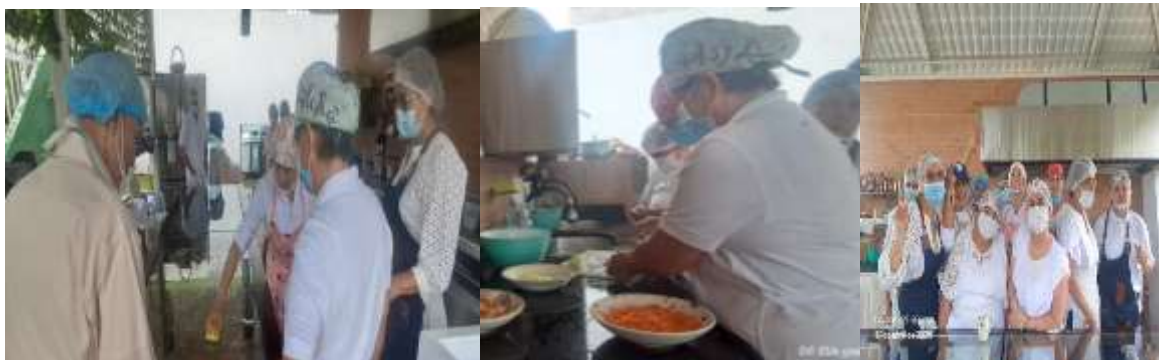
Evidencia 4- Material fotográfico del desarrollo del curso en higiene y manipulación de alimentos grupo 3469895. Vrda. Panamá bajo.