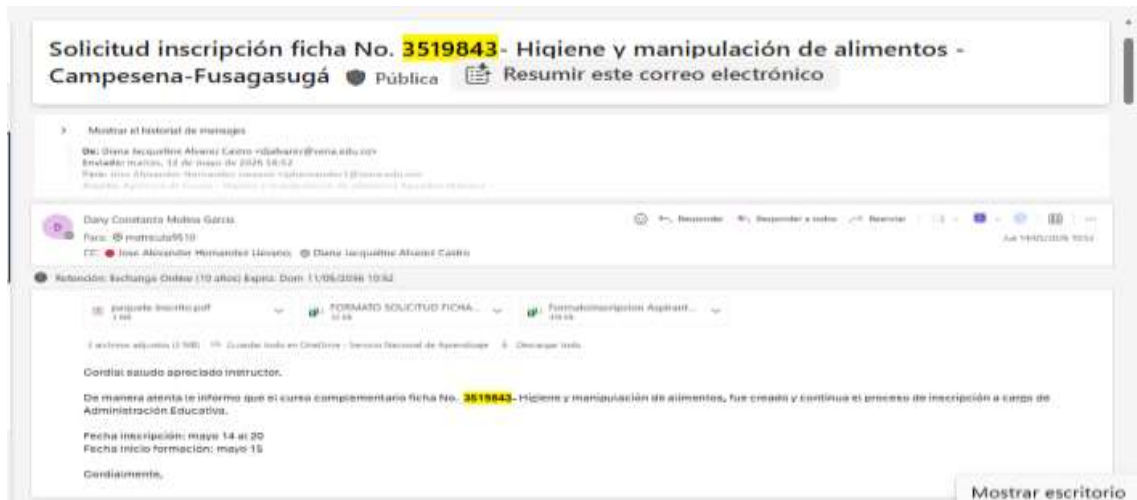
Evidencia 15. Captura de pantalla del correo de trazabilidad la solicitud de apertura e inscripción del grupo: 3519843 que fue inscrito sin ninguna novedad.