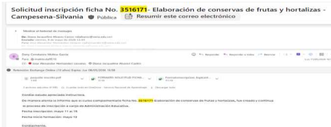
Evidencia 13. Captura de pantalla del correo de trazabilidad la solicitud de apertura e inscripción del grupo: 3516171 que fue inscrito sin ninguna novedad.