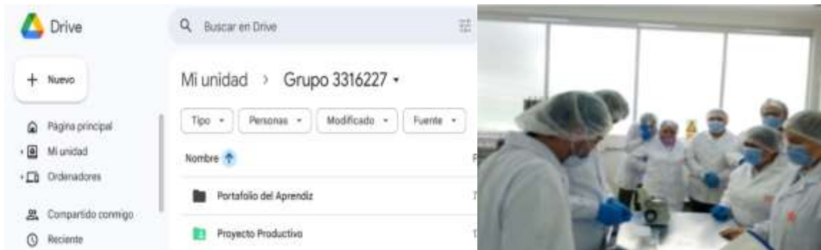
Evidencia 3- Captura de pantalla de la carpeta drive- y ambiente de aprendizaje del grupo: 3316227. Tecnólogo en control de Calidad en la Industria de Alimentos.