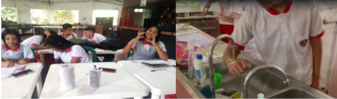
Evidencia 1- Material fotográfico del desarrollo del curso en higiene y manipulación de alimentos grupo 3457816. Colegio Luis Carlos Galán. Vrda. Chinauta