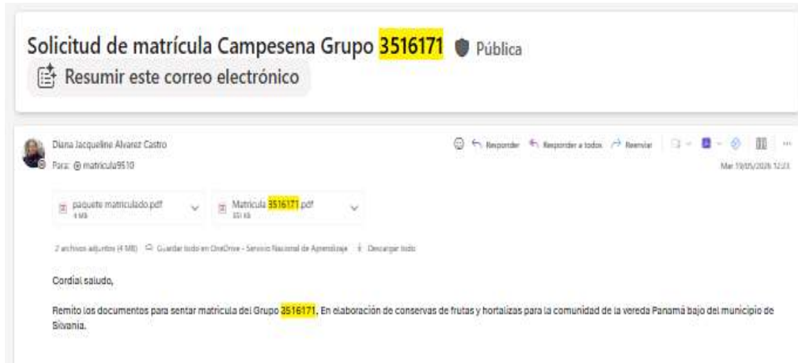
Evidencia 16. Captura de pantalla del correo de solicitud de matrícula del grupo 3516171 enviado a administración educativa.