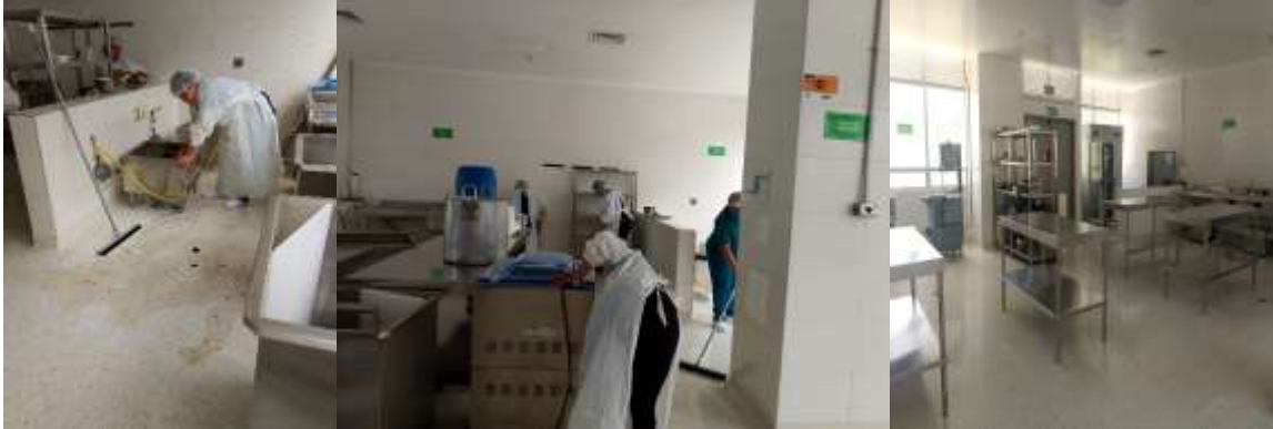
Evidencia 5- Material fotográfico de la organización y la limpieza y desinfección del Taller de Cárnicos del centro de formación con el grupo 3316227. Tecnólogo en control de Calidad en la Industria de Alimentos.