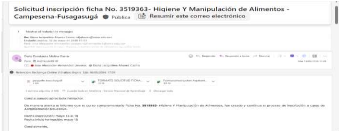
Evidencia 14. Captura de pantalla del correo de trazabilidad la solicitud de apertura e inscripción del grupo: 3519363 que fue inscrito sin ninguna novedad.