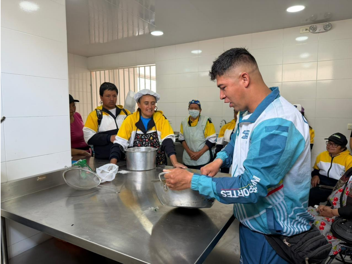
INTEGRACION DOCENTE DE ACITIVIDAD FISICA, PREPARACION DE CREPPES SALADOS Y DULCES 23 DE ABRIL 2026