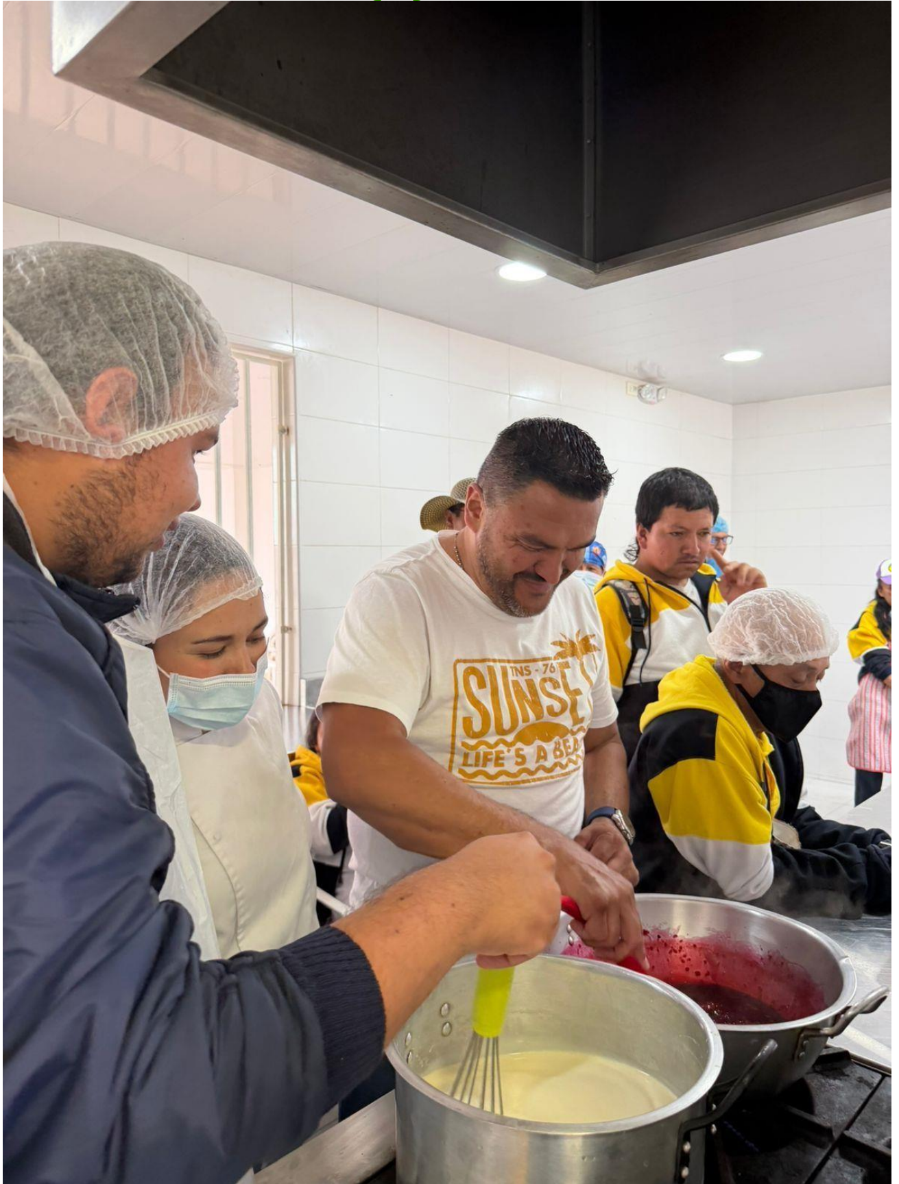
ELABORACION DE POSTRE FRIO COULISS DE FRUTOS ROJOS 21 DE ABRIL 2026