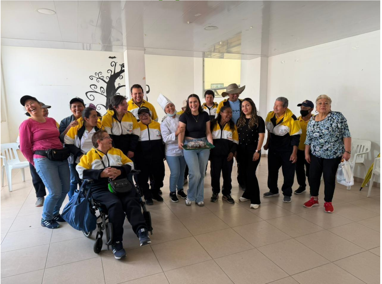
FORMACION INTEGRAL PROFESIONAL 3457710 INTEGRACION GRUPO DE DISCAPACIDAD DIA 20 DE ABRIL 2026