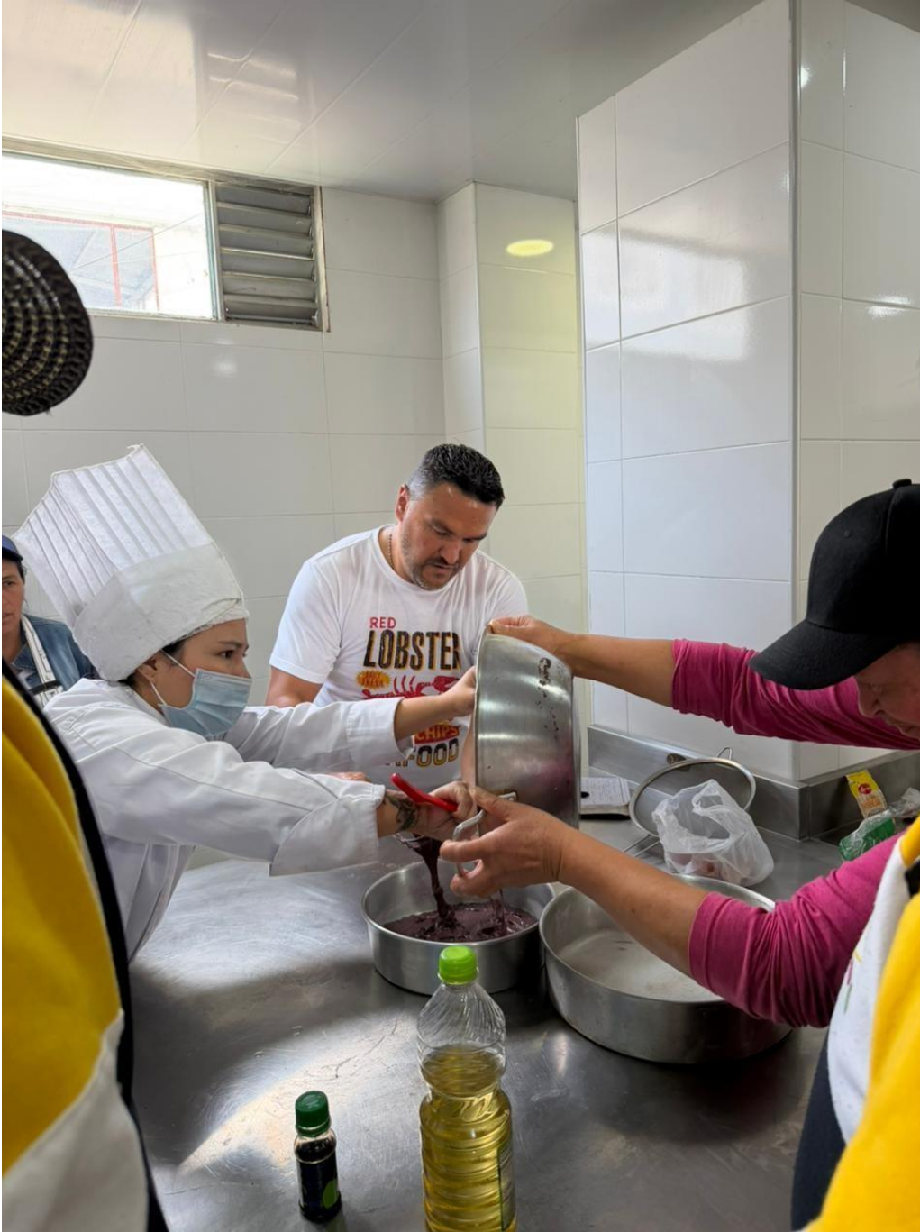
ELABORACION DE MASA PESADA TORTA DE VINO 22 DE ABRIL 2026