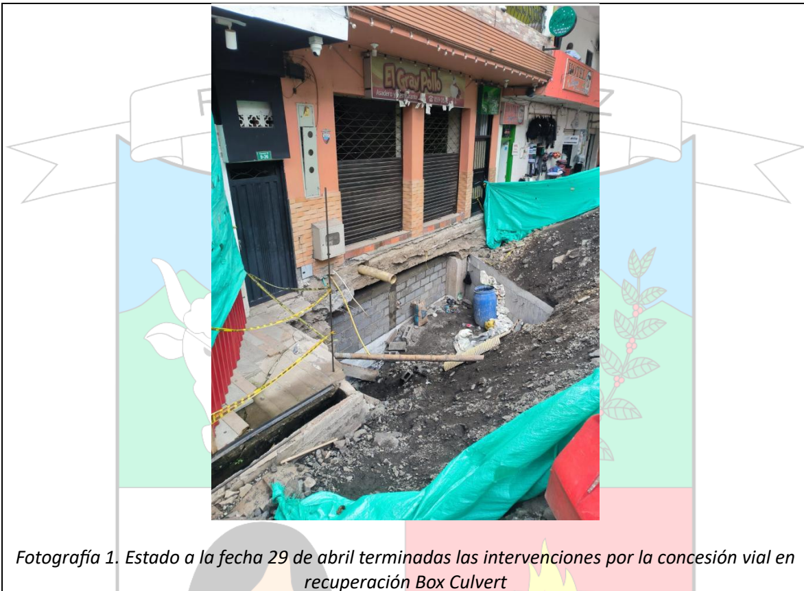
Fotografía 1. Estado a la fecha 29 de abril terminadas las intervenciones por la concesión vial en recuperación Box Culvert

CÓDIGO: PE - DIR – 150 VERSIÓN: 01 FECHA DE APROBACIÓN: AGOSTO 25 DE 2025 HOJA: 3