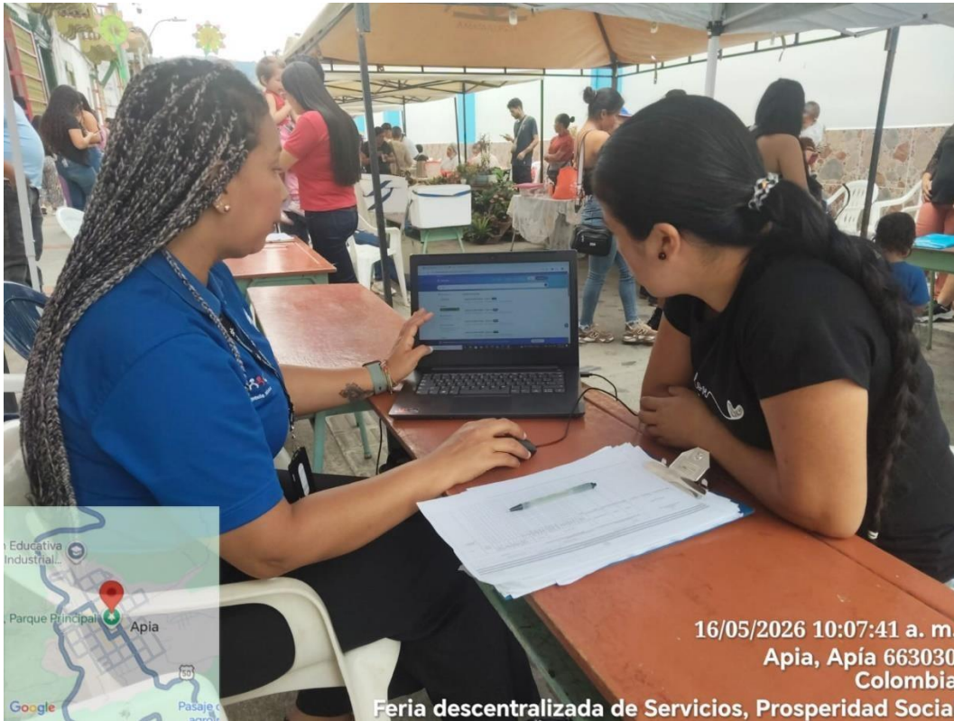
Concertación Resguardo sirodó APIA (planes de restitución y reubicación)