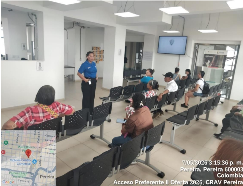
Reunión, avance de indicadores.