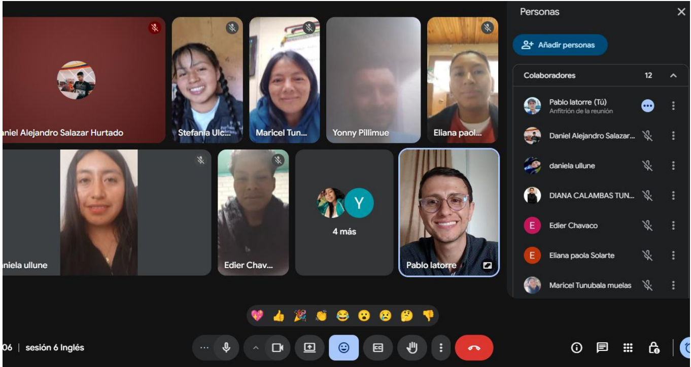
Imagen 1. Evidencia Formación Técnico Contabilización de Operaciones Comerciales y Financieras - 30 abril