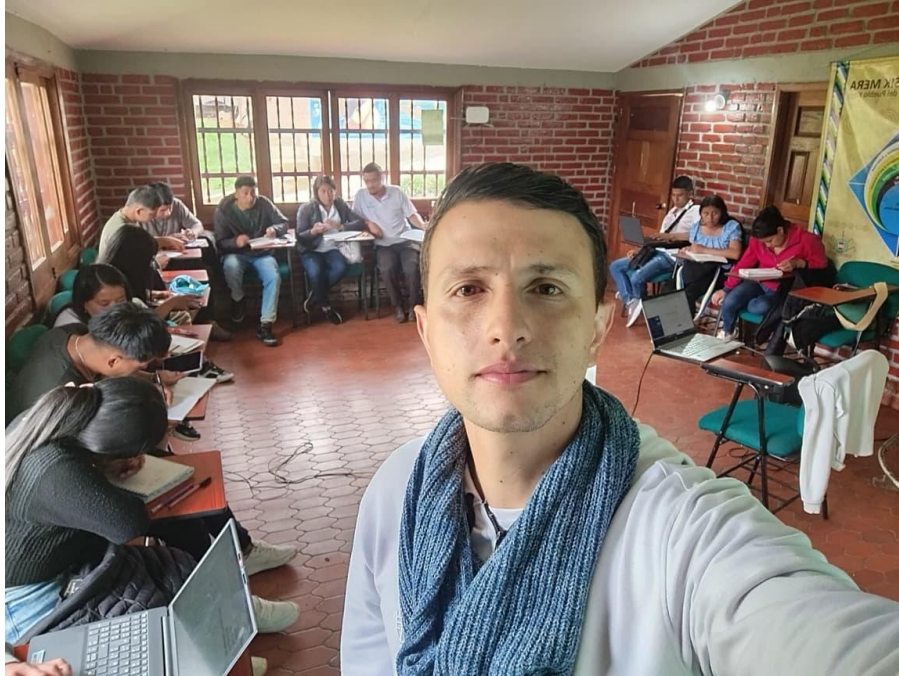
Imagen 1. Evidencia Formación Técnico Contabilización de Operaciones Comerciales y Financieras - 16 abril