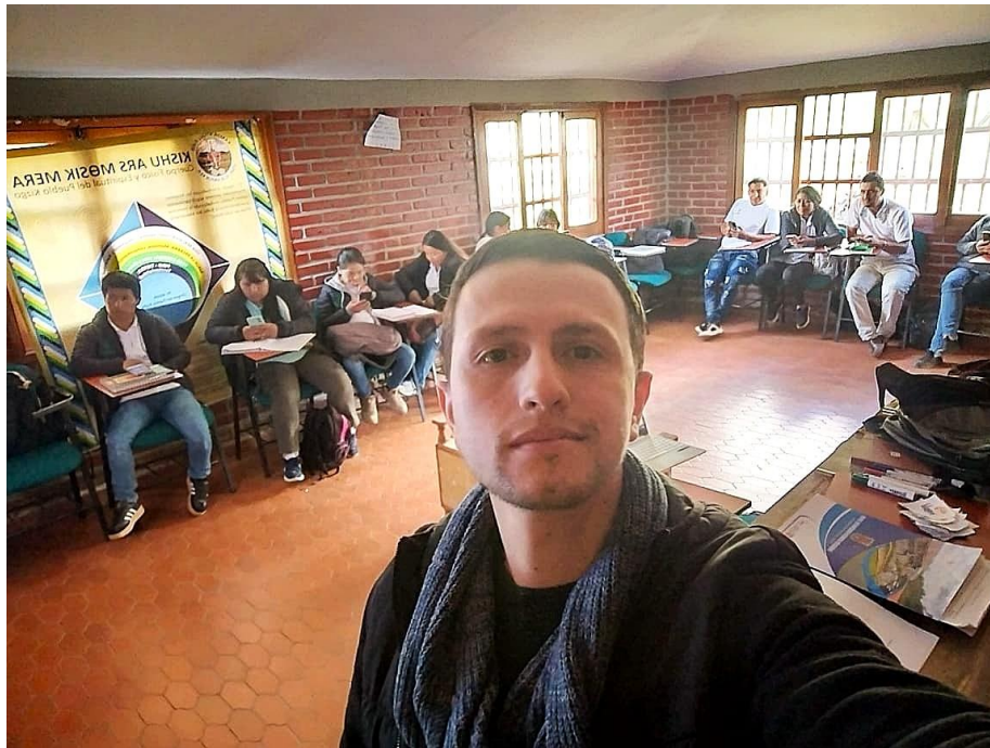
Imagen 1. Evidencia Formación Técnico en Contabilización de Operaciones Comerciales y Financieras - 23 abril