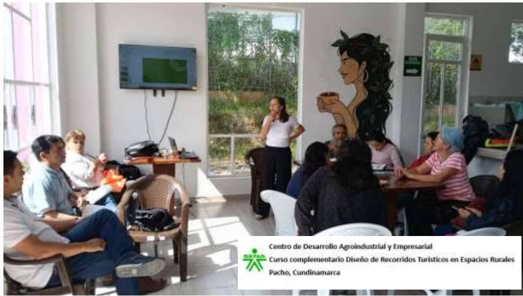
Centro de Desarrollo Agroindustrial y Empresarial Curso complementario Diseño de Recorridos Turísticos en Espacios Rurales Pachó, Cundinamarca