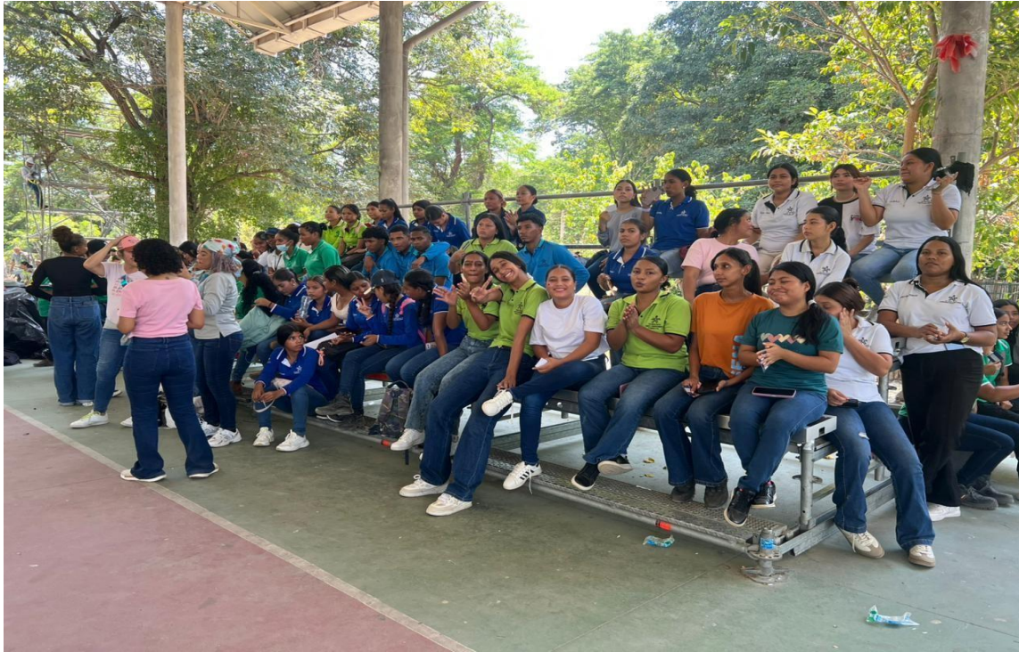
PARTICIPACION EN SEGUNDA FASE