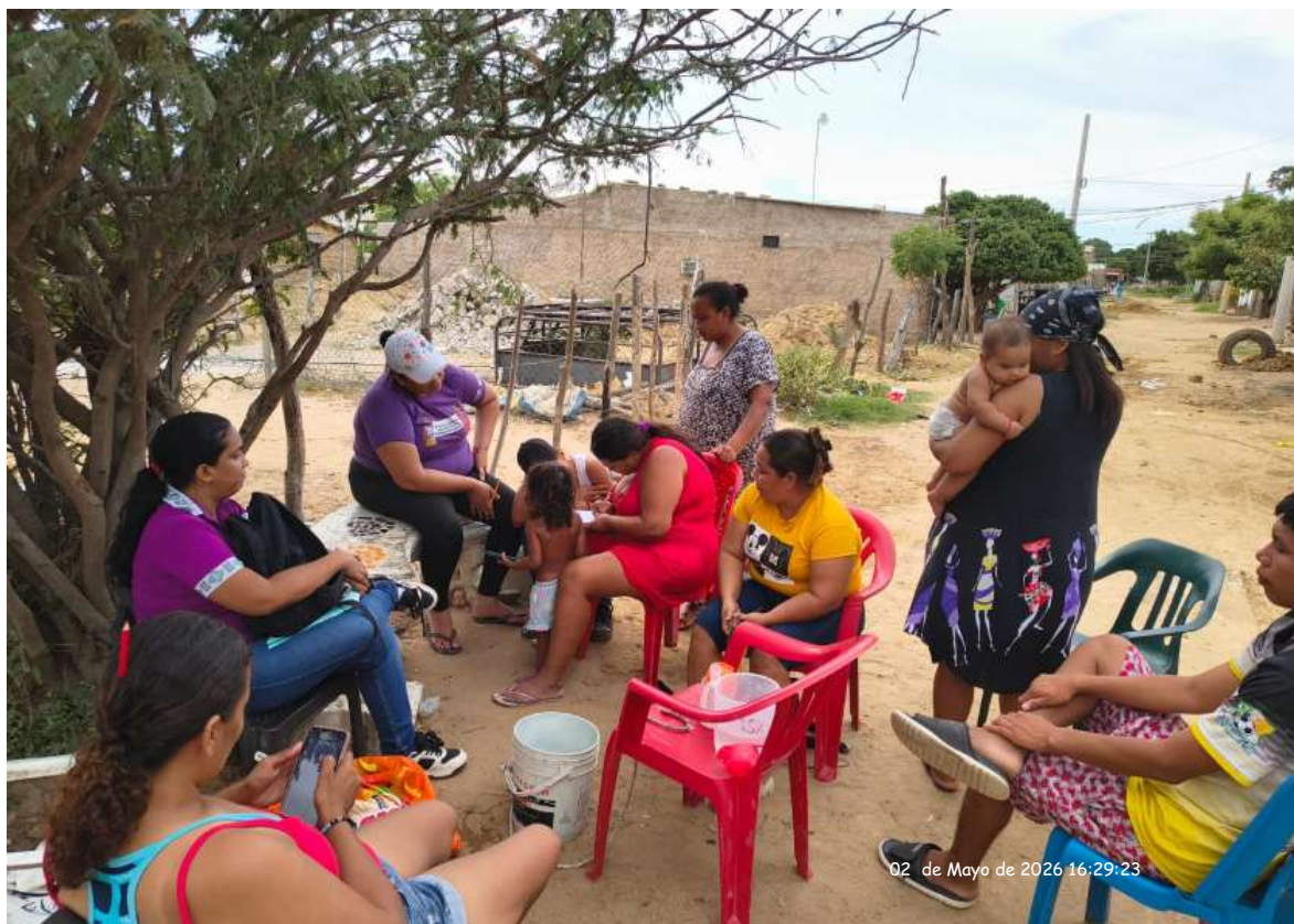
Ilustración 1 Oferta de formación comunidad del comunidad de los cardonales

Nota: Oferta de formación comunidad los cardonales en Riohacha