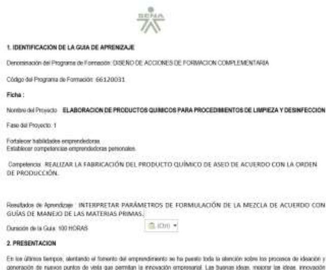
Ilustración 6 Guía de aprendizaje

Nota: guía de aprendizaje programa de Elaboración de productos químicos para procedimientos de limpieza y desinfección