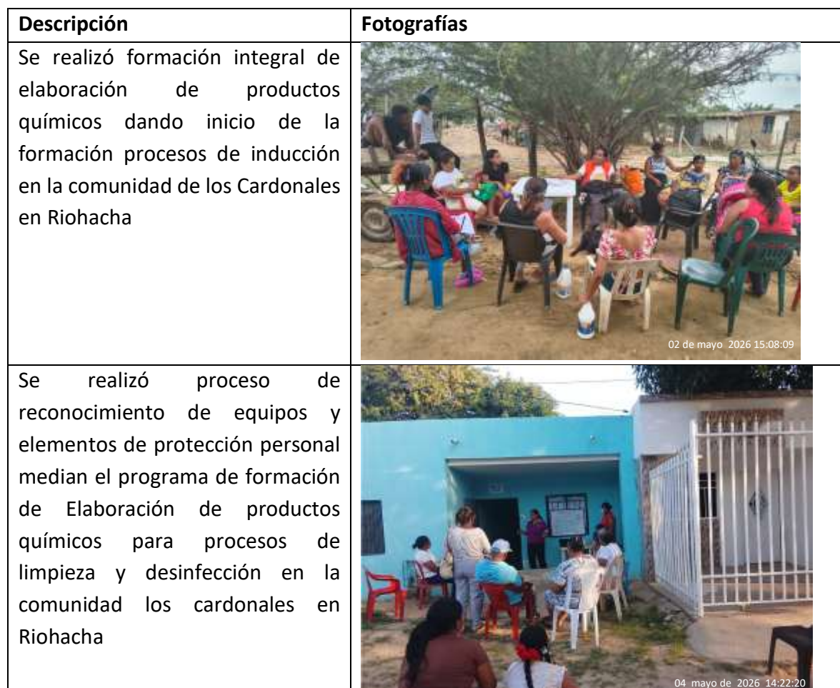
Ilustración 5 formación Profesional Integral