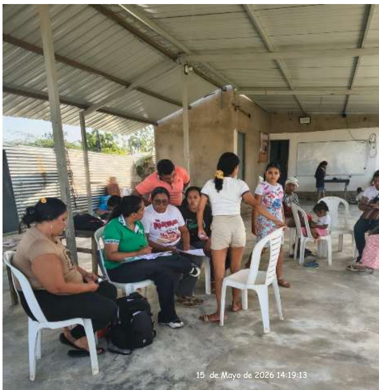
Ilustración 3 Oferta de formación comunidad Villa del sur

Nota: Oferta de formación comunidad Villa del Sur