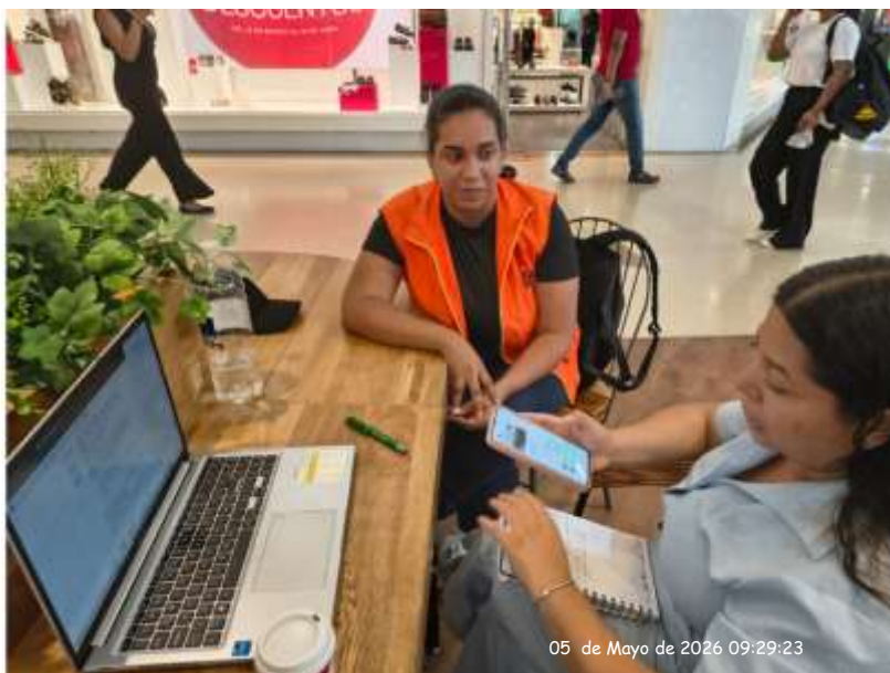
Ilustración 2 Oferta de formación y articulación con la fundación PAISS

Nota: Oferta de formación comunidad fundación PAISS articulación para programas de formación en la ciudad de Riohacha y Maicao