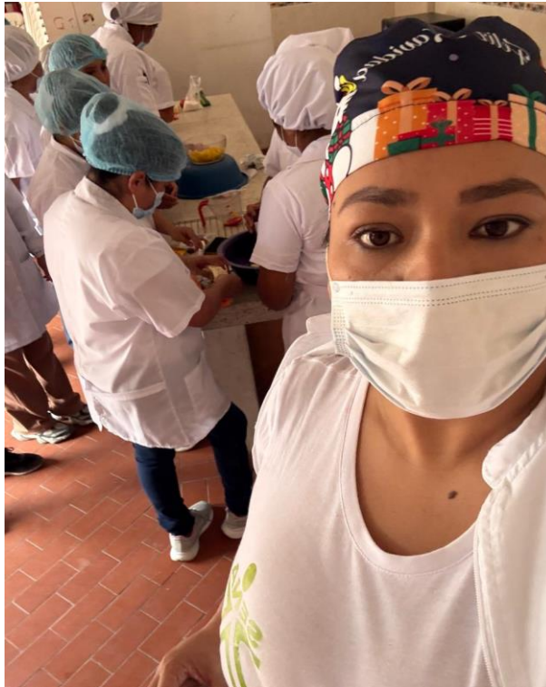
- Evidencia 27 de abril, Inza – San Andrés de Pisimbala, Auxiliar de Cocina – Ficha 3411870