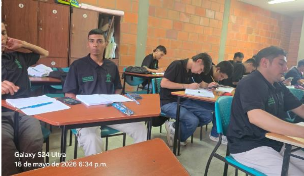
Formación 3411827 del técnico en electricidad residencial, comercial y de sistemas fotovoltaicos él 19 de mayo