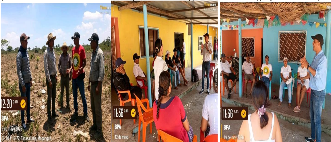
Evaluación de conocimientos de las BPA (ACTIVIDAD LUDICA) instalaciones para el cultivo y sus herramientas