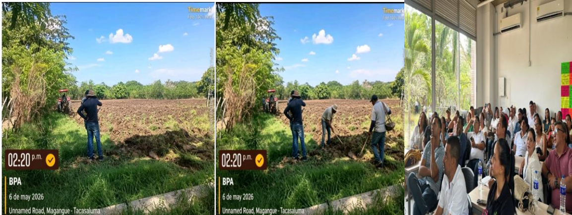
(Practica de reconocimiento de suelos aplicando las BPA)( labores culturales )(Capacitación C.G)