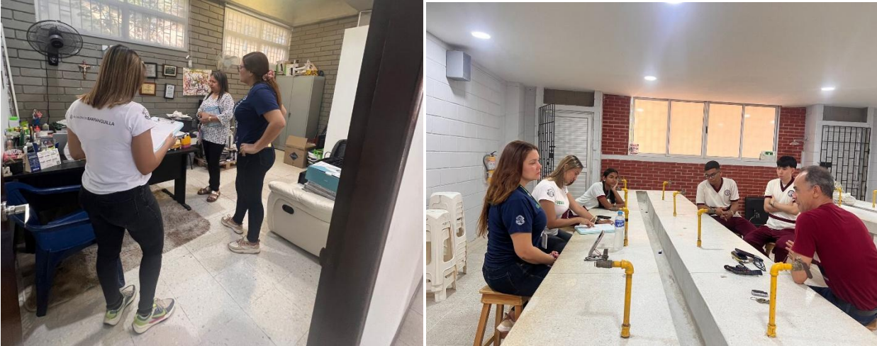
Visitas desarrolladas por el equipo PRAE en IED Barrio Montes e IED La Magdalena el día 5 de mayo