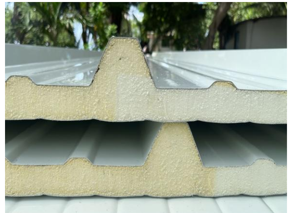
Foto 4 - CABAÑA MANGLE