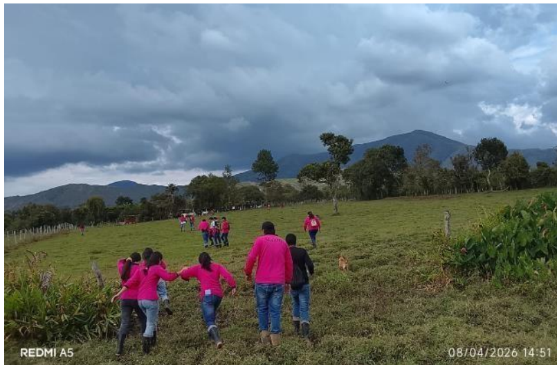
Ilustración 4. Se impartió formación a las fichas 3146287