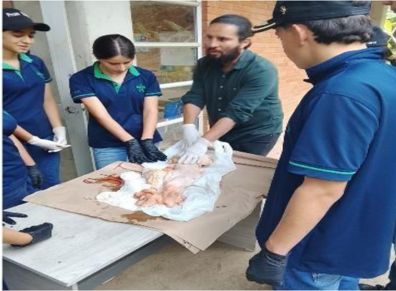
Ilustración 6. Se impartió formación a las fichas 3146289

EVIDENCIA 3. Obligación 5: Aplicar según la modalidad, estrategias de enseñanza, aprendizaje, seguimiento y evaluación de acuerdo a los lineamientos pedagógicos y metodológicos de la entidad. Se desarrollo la guía RAE 1, en los municipios de Onzaga, Mogotes, Confines, Suaita, Ocamonte y Guadalupe sus respectivas fichas y grupos; 3161704,3146290,3146287, 3146241,3146289,3159486.