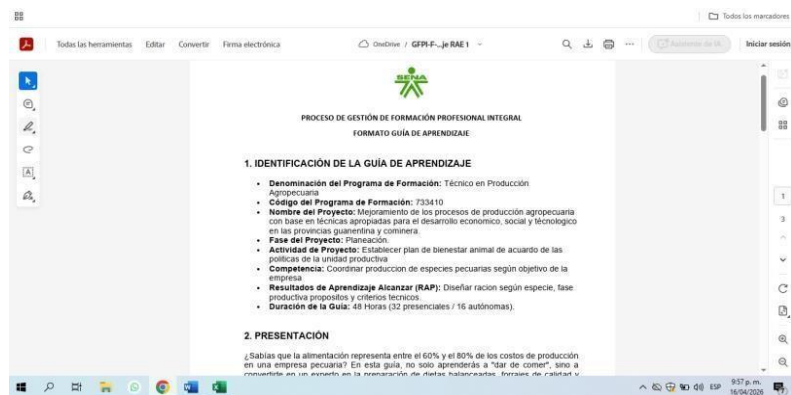
Ilustración 7. Se desarrollo la guía RAE 1, sus respectivas fichas y grupos; 3161704,3146290,3146287, 3146241,3146289,3159486.

EVIDENCIA 3. Obligación 5: Aplicar según la modalidad, estrategias de enseñanza, aprendizaje, seguimiento y evaluación de acuerdo a los lineamientos pedagógicos y metodológicos de la entidad. Se desarrollo la guía RAE 1, en los municipios de Onzaga, Mogotes, Confines, Suaita, Ocamonte y Guadalupe sus respectivas fichas y grupos; 3161704,3146290,3146287, 3146241,3146289,3159486.