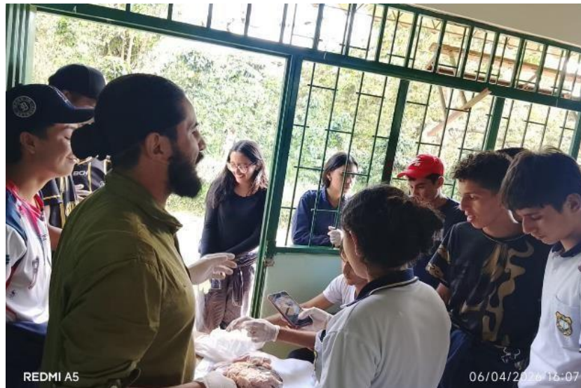
Ilustración 5. Se impartió formación a las fichas 3146241