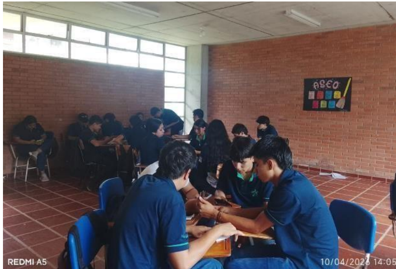
Ilustración 2. Se impartió formación a las fichas 3161704