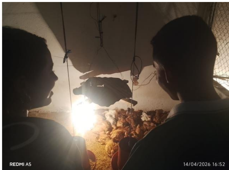
Ilustración 3. Se impartió formación a las fichas 3146290.