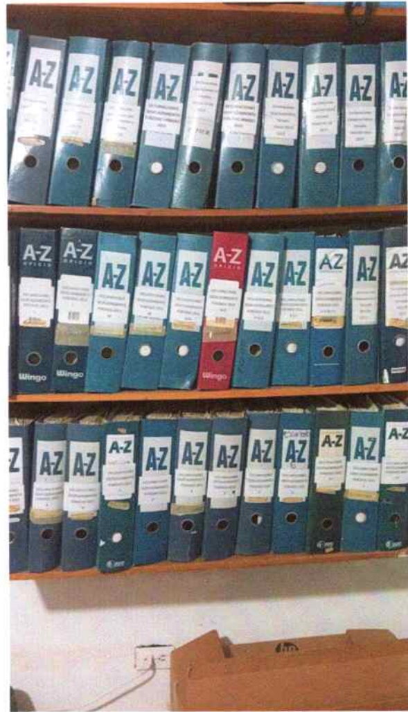
Organización de archivos de los documentos generados periodo 03/06/2025 – 02/07/2025