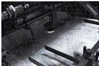
Suministro de Servicios de Impresión II

Una vez consultada la Tienda Virtual del Estado Colombiano, se encuentra que actualmente NO existe Acuerdo Marco que incluya los servicios de suministro de material impreso y material POP, el acuerdo marco número CCE-103-AMP-2021 cuyo objeto es Suministro de Servicios de Impresión II tuvo vigencia hasta el 25 de julio de 2023.