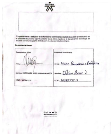
Acta de aceptación e iniciación de masa Madre pag. 3