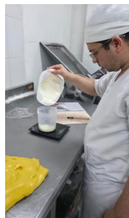
Creación de la masa madre en la panadería Deli Norte