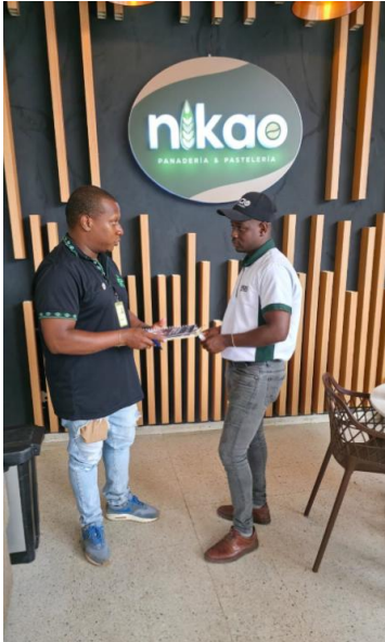
Visita a la Panadería Nikao, explicando sobre El proyecto de masa madre