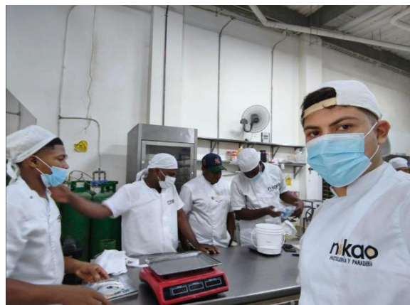
Alimentación de la masa madre en la panadería NIKAO