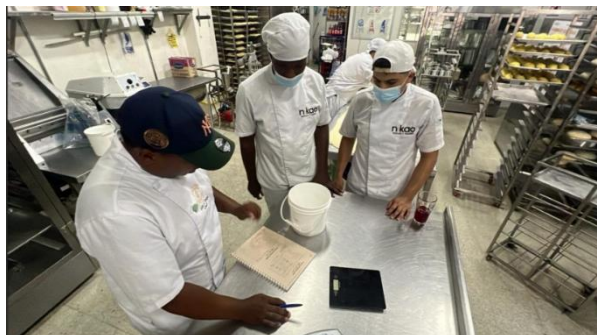
Creación de masa madre en la panadería NIKAO, lo cual se le hace seguimiento en el libro