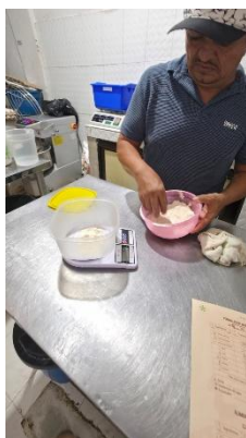
Creación de masa madre