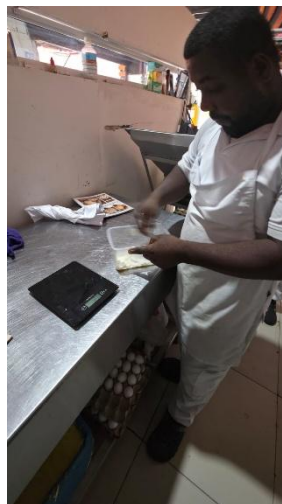
Alimentación de masa madre