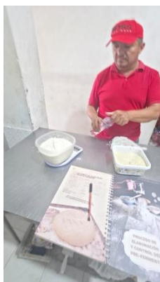
Elaboración del pan de masa madre