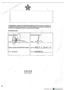
Imagen N° 10