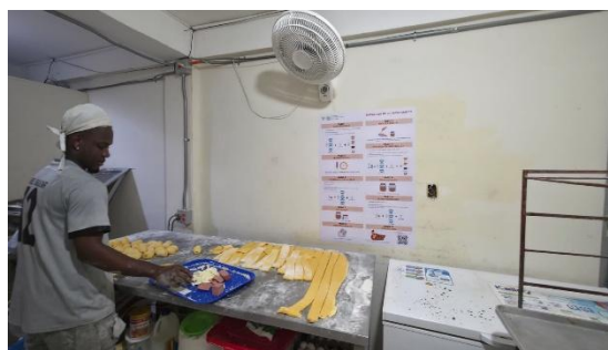
decálogo en la panadería Bocaditos