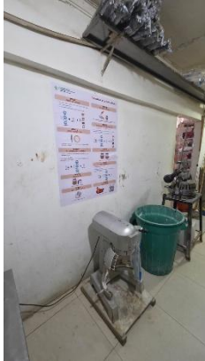
decálogo panadería Rico Pan