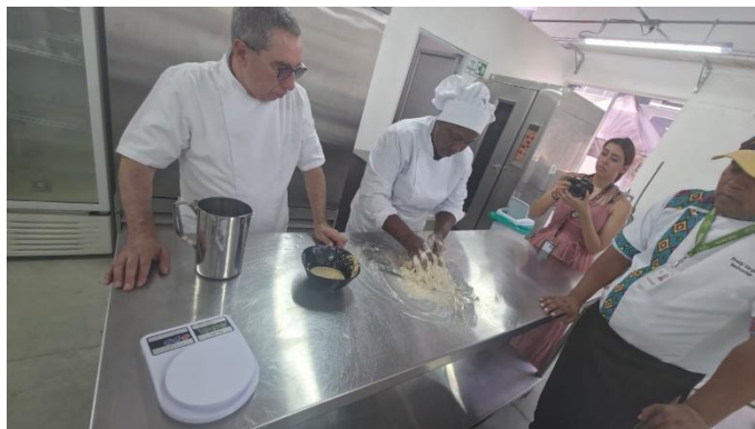
Imagen N° 2

Elaboración de masa de pan de masa madre con el apoyo de una aprendiz por parte de la visita.