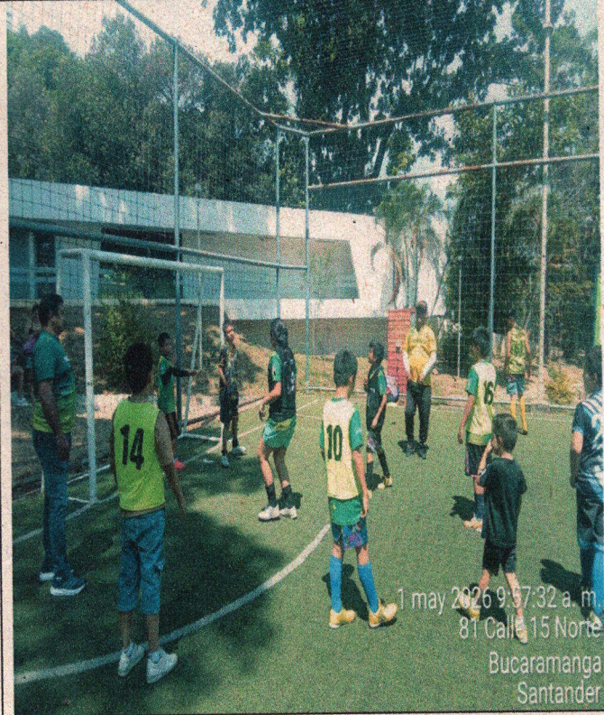
1 may 2026 9:57:32 a. m. 81 Calle 15 Norte Bucaramanga Santander