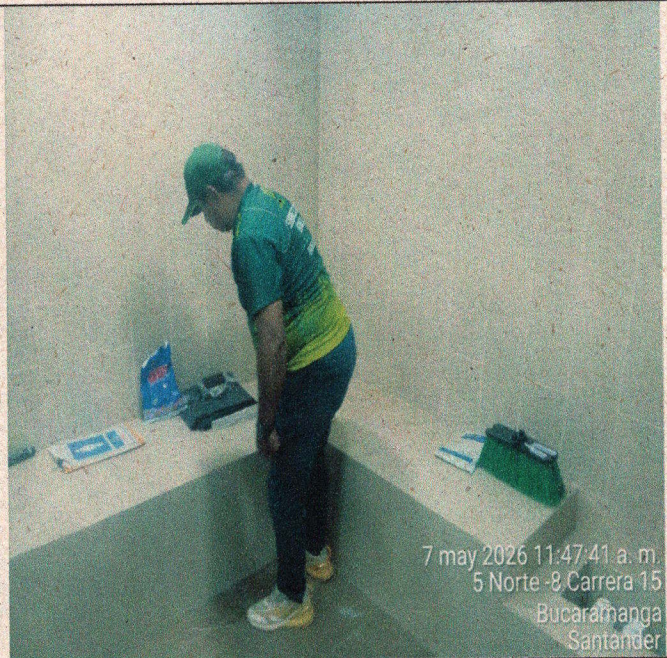
7 may 2026 11:47:41 a. m. 5 Norte -8 Carrera 15 Bucaramanga Santander