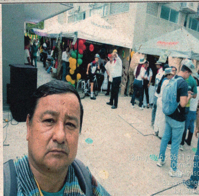
13 may 2026 2:26:11 p. m. Carrera 80 San Alonso Bucaramanga Santander