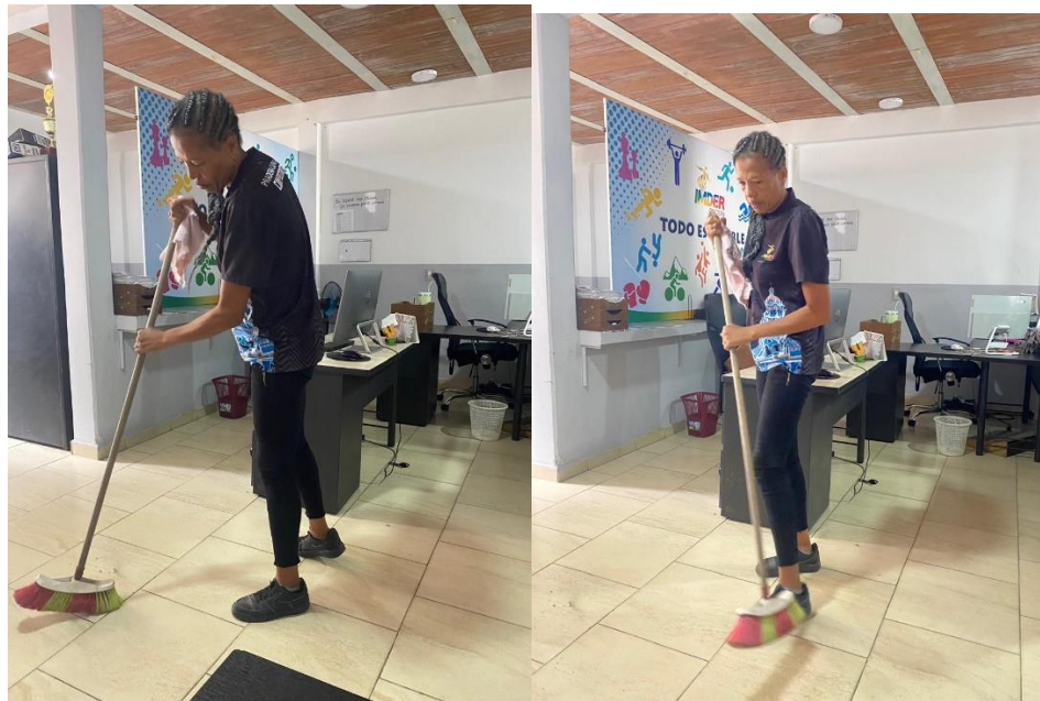
Fotografía 18 y 19 Labores de aseo general en zonas comunes para garantizar orden y adecuada presentación de las instalaciones.