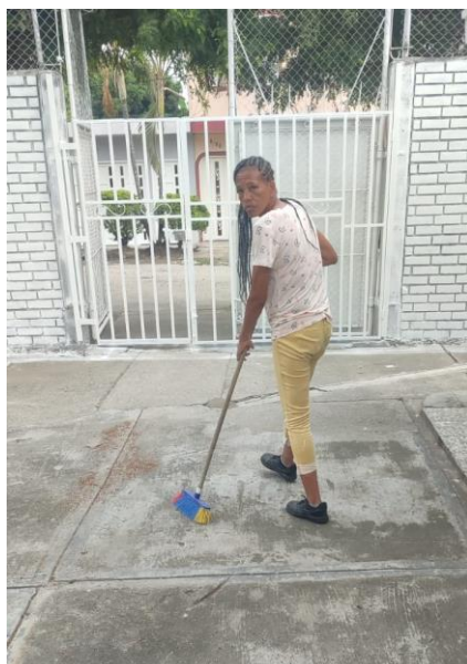
Fotografía 15. Actividades de barrido, limpieza y conservación realizadas en instalaciones institucionales y zonas de uso común.