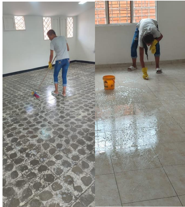
Fotografía 23 y 24. Realización de labores de limpieza en oficinas y espacios administrativos, contribuyendo a mantener ambientes organizados y agradables para la atención de usuarios.