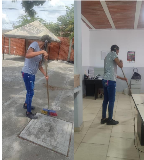
Fotografía 16 y 17. Adecuación y mantenimiento preventivo de espacios institucionales mediante jornadas de limpieza y organización.