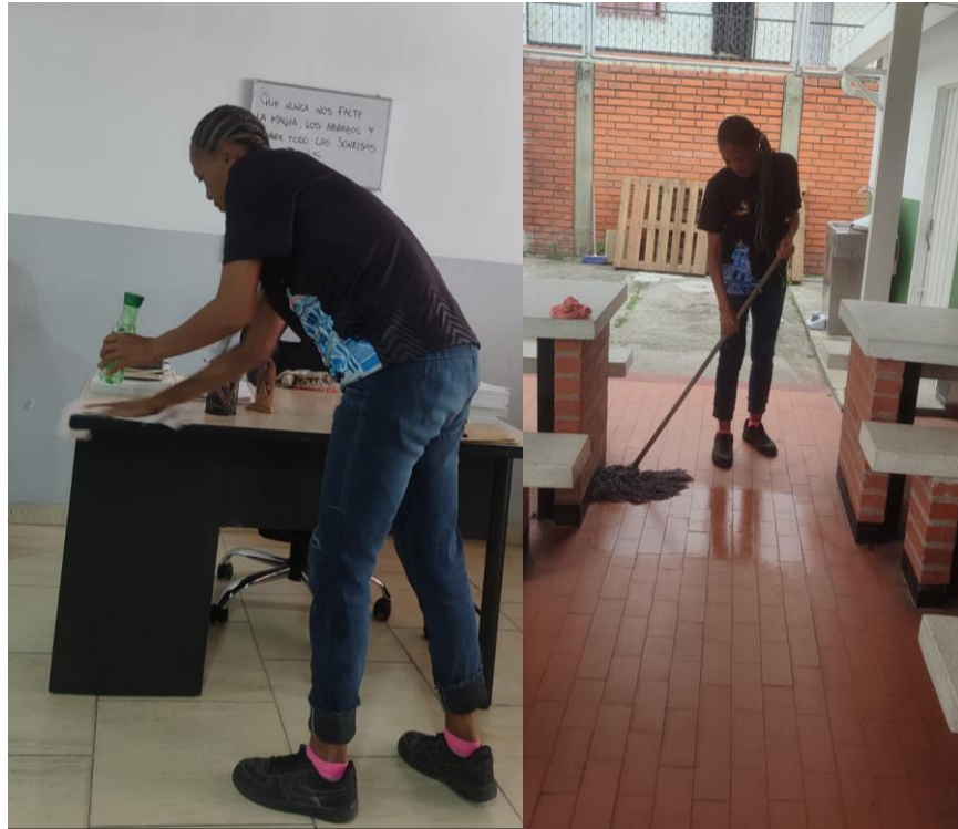
Fotografía 3 y 4 Desarrollo de actividades de limpieza general y mantenimiento en áreas comunes, contribuyendo a la adecuada presentación de las instalaciones.