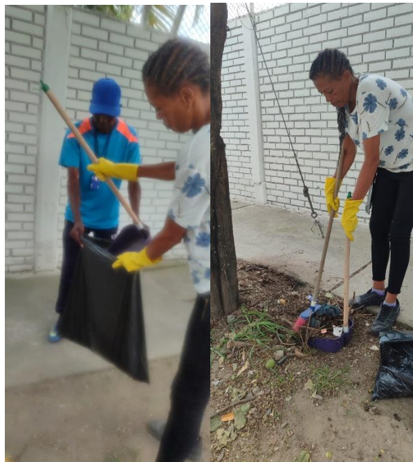
Fotografía 21 y 22. Actividades de mantenimiento preventivo y aseo en zonas externas e internas del Instituto.