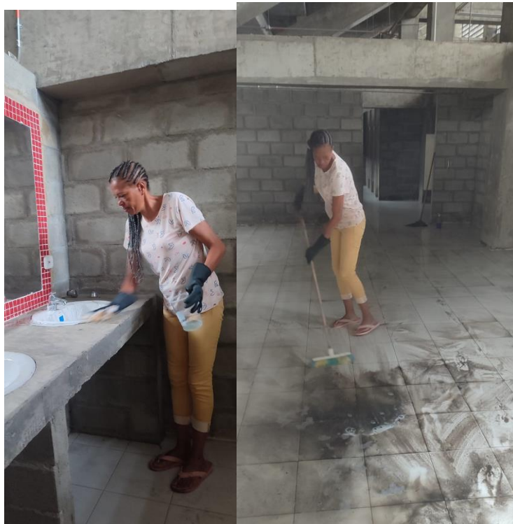
Fotografía 11 y 12 Desarrollo de labores de mantenimiento y limpieza en escenarios deportivos, garantizando espacios óptimos para la práctica deportiva y recreativa.