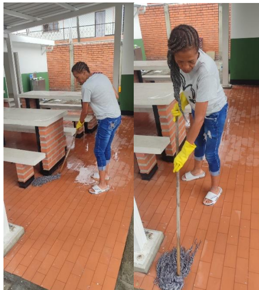
Fotografía 25 y 26 Mantenimiento y aseo de zonas comunes como parte de las actividades permanentes de conservación institucional.