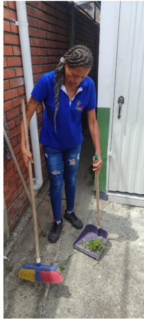
Fotografía 20. Ejecución de jornadas de limpieza y desinfección en oficinas administrativas, mobiliario y áreas de circulación, garantizando ambientes adecuados para el funcionamiento institucional..