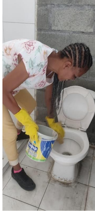
Fotografía 1 Actividad de aseo y desinfección en unidades sanitarias, fortaleciendo las condiciones de higiene y bienestar para funcionarios y usuarios.