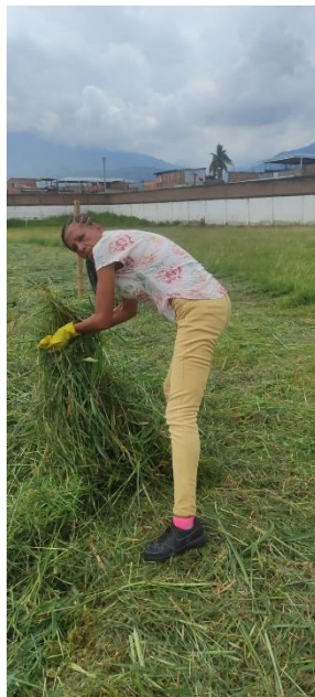
Fotografía 2 Desarrollo de mantenimiento preventivo y aseo en instalaciones deportivas, garantizando espacios organizados y en adecuadas condiciones de salubridad.