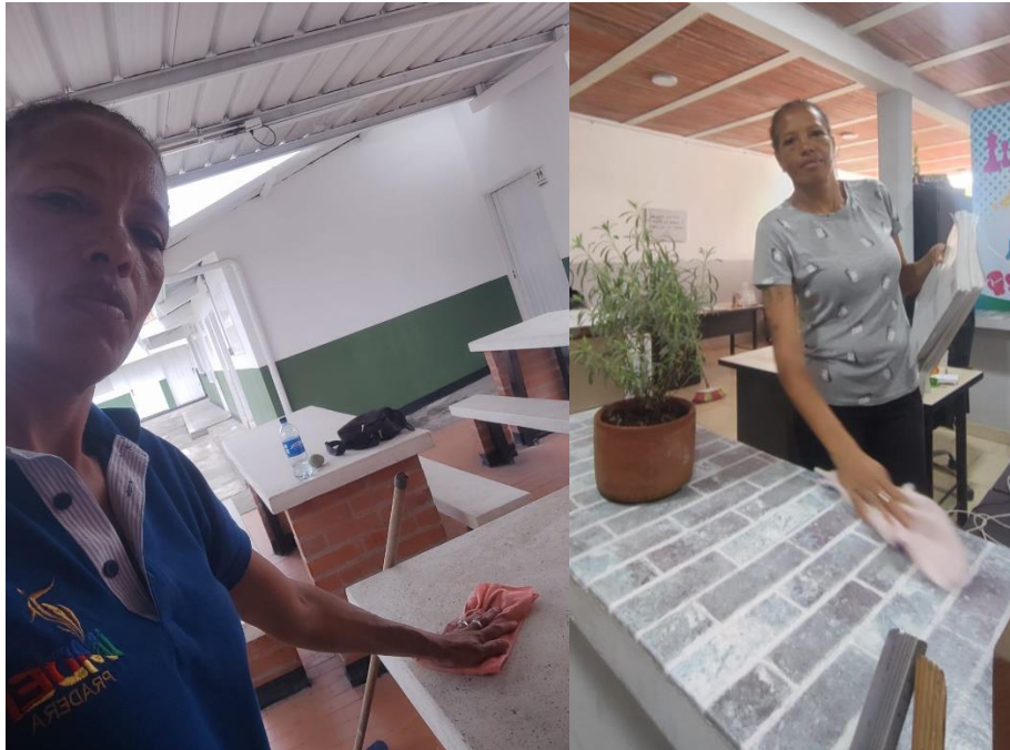
Fotografía 9 y 10. Organización, limpieza y mantenimiento de oficinas administrativas y áreas externas del Instituto.