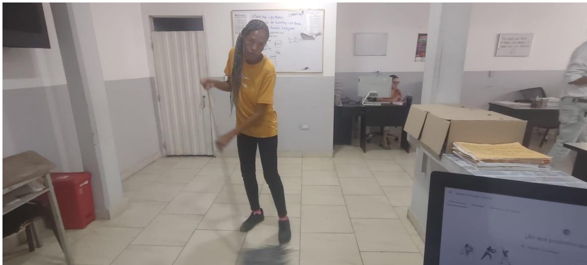
Fotografía 5. Labores de adecuación, barrido y mantenimiento preventivo en espacios institucionales y zonas comunes del IMDERPRADERA.