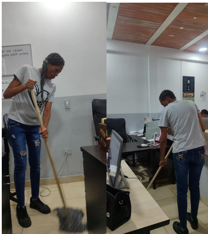
Fotografía 27 Apoyo en actividades de mantenimiento y limpieza de instalaciones institucionales, favoreciendo la conservación de los espacios.