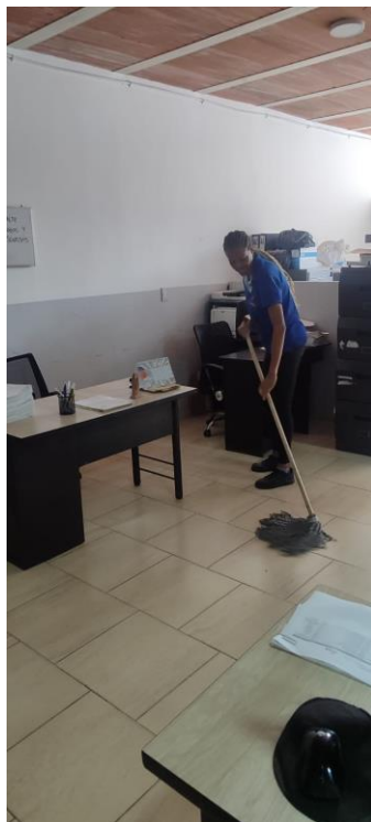
Fotografía 8. Desarrollo de labores de mantenimiento y aseo en zonas comunes..