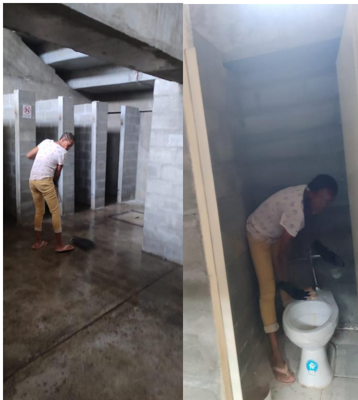
Fotografía 13 y 14 Proceso de limpieza y desinfección de unidades sanitarias como parte de las actividades permanentes de mantenimiento locativo.