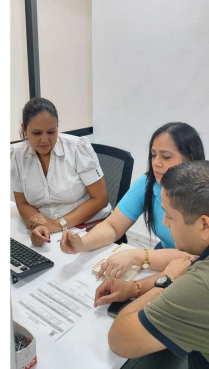
Reunión - Equipo de Contratación