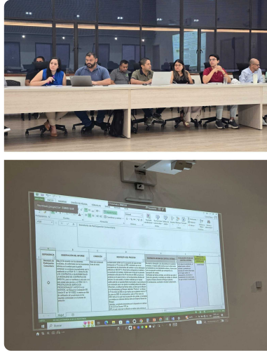
Asistencia a Cierre de Auditoria