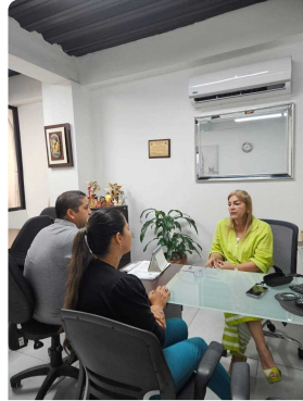
Reunión con ordenadora del gasto