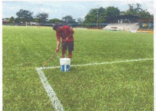
Demarcación de líneas de la cancha del estadio para que este en óptimas condiciones para el campeonato Interbarrios