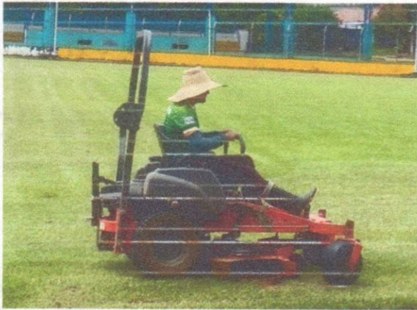
Mantenimiento césped del estadio municipal con el carro

Se realizó el mantenimiento y la limpieza de los diferentes escenarios deportivos del municipio de Puerto Rico, Caquetá, con el propósito de garantizar espacios seguros y funcionales para el desarrollo de actividades físicas con las escuelas de formación, recreativas y competitivas los fines de semana con los campeonatos.