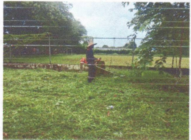
Mantenimiento con guadaña al exterior de la cancha Puerto Limón