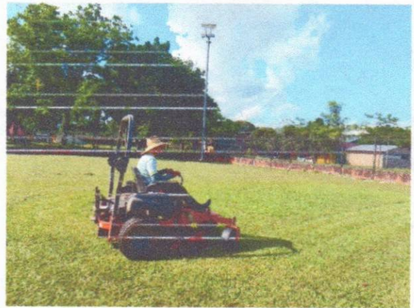
Mantenimiento Realice corte césped de la cancha La Rabonera