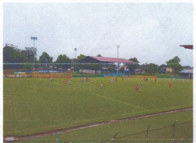
Verificación del estado de la cancha Estadio Municipal