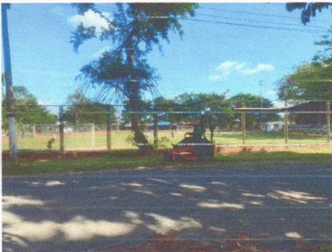
Mantenimiento alrededor de la cancha Rabonera