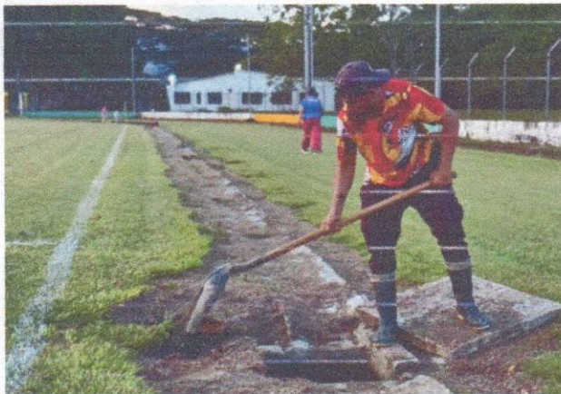
Mantenimiento desagües del Estadio Municipal

La finalidad fue evaluar su estado general, garantizando que se encuentren en condiciones óptimas, seguras y adecuadas para el adecuado uso y disfrute de la comunidad.