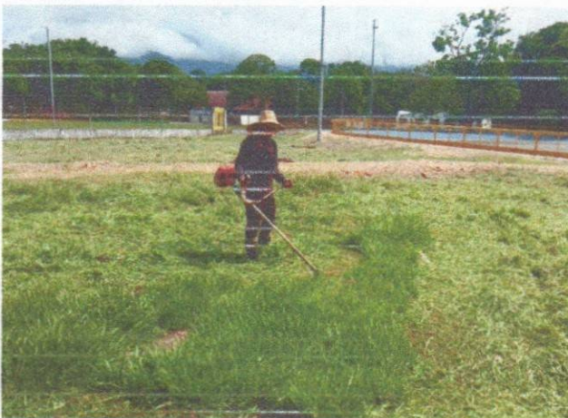
Mantenimiento con guadaña al exterior de los escenarios deportivos del estadio municipal