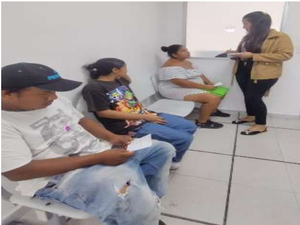
ORIENTACION A LOS USUARIOS